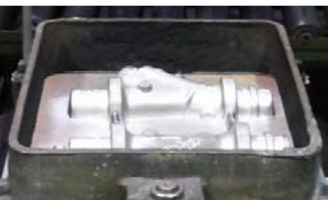
Formkasten mit Ventilkontur

Als Gusswerkstoffe kommen verschiedenste Bronze-, Messing- und Aluminiumlegierungen zum Einsatz. Unser Produktdesign- und Mitarbeitererteam erarbeitet Komplettlösungen nach Ihren Vorgaben - vom Konzept bis zum fertigen Produkt - von der Produktidee bis zu den Produktionsbedingungen. Wir begleiten unsere Kunden umfassend während des gesamten „Design to manufacture - Prozess“. Vom guss- und fertigungsgerechten, gewichtsoptimierten, visualisierten 3D-Prototypen über den Formenbau und die Erstellung der Kernkästen, bis hin zu einem schlanken, kosteneffizienten, spanenden Fertigungsprozess in der Klein- und Großserienfertigung.