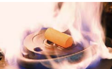
Pressbutzen im Gesenk

Hohe Druckdichtigkeit, Festigkeit und eine schleif- und polierfähige Oberfläche begünstigen Pressteile gegenüber Gussteilen. Die spanende Weiterverarbeitung der Pressteile erfolgt auf modernen Rundtakt-Mehrwegeautomaten oder bauteilabhängig auf flexiblen CNC-Bearbeitungszentren.