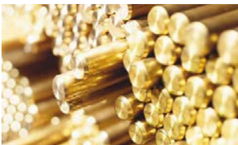
Press- und Ziehprodukte aus Messing