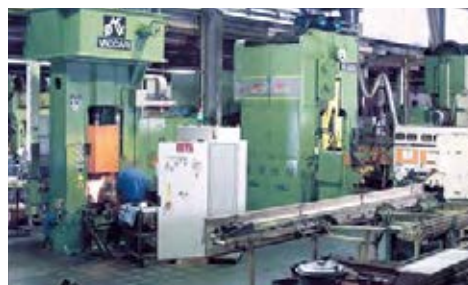
Wirtschaftlichkeit durch den Einsatz moderner Gesenkschmiedeautomaten