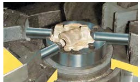
Minimierung des Einsatzgewichtes durch das Hohlpressverfahren