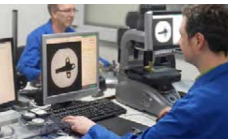
optische Vermessung mit digitalen Messprojektoren

um mit statistischen Methoden ausgewertet zu werden - CAQ-System. CAQ (computer aided quality assurance) steht für computergestützte Qualitätssicherung. CAQ-Systeme analysieren, dokumentieren und archivieren qualitätsrelevante Daten zu Fertigungsprozessen.