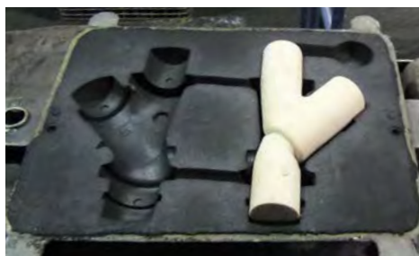
maximale Materialersparnis durch formgenaue Sandkerne