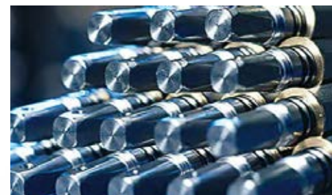
Drehteile aus Edelstahl