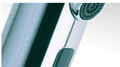
Veredelung und Montage