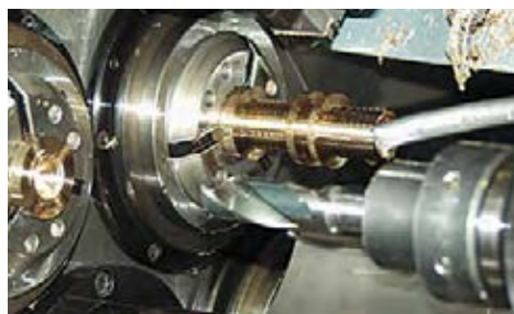
Spanende Bearbeitung von Drehteilen