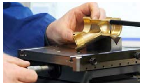
Prüfung mittels Konturograph