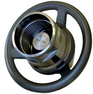
Schraubkupplungen der Serie CH Screw type couplings series CH