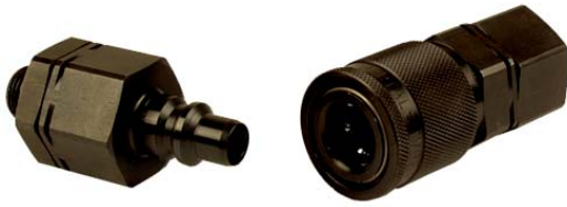
Hochdruck-Kupplungen der Serie HP High pressure couplings series HP