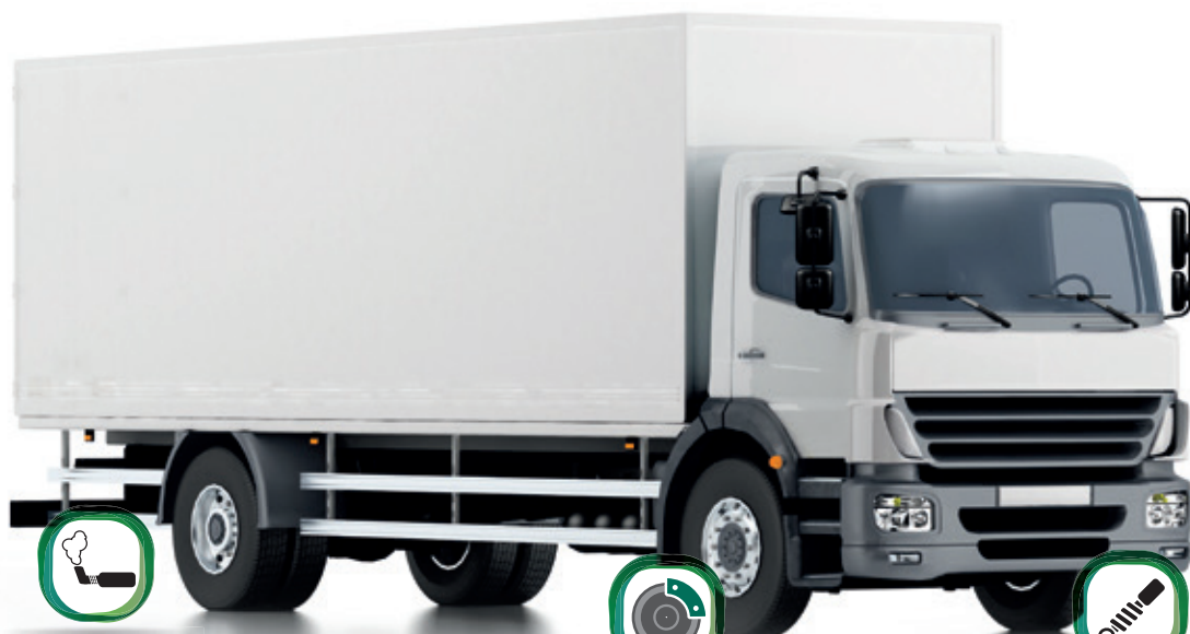
拖车空气制动系统