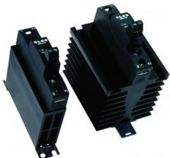
TABELLA SELEZIONE RELE' - RELAY SELECTION TABLE