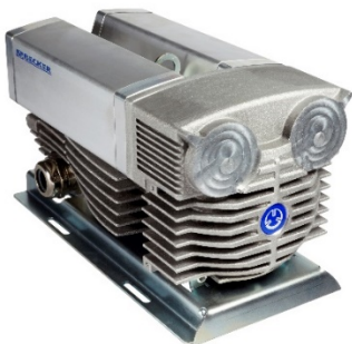
Bild 2 Mit erhöhtem Wirkungsgrad: Seitenkanalverdichter VASF 2.50 mit Schalldämpfer