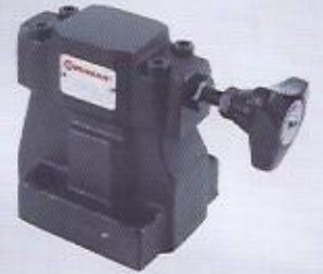
WINMAN pleyt tipi basınç emniyet valfi WINMAN solenoid controlled relief valve