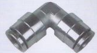
WINMAN metal dirsek bağlantı WINMAN swivel elbow