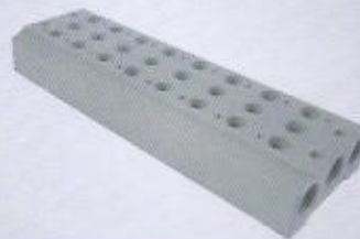
WINMAN manifoldlar WINMAN manifolds