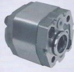
WINMAN power pack pompalar WINMAN power pack pumps