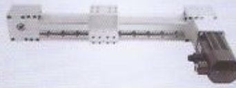
WINMAN MC serisi trigger kayışlı uygulama WINMAN MC series linear modular application