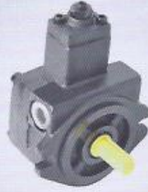
WINMAN değişken debili paletli pompalar WINMAN variable displacement vane pump