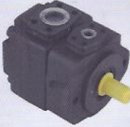
WINMAN paletli pompalar WINMAN vane pumps