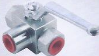
WINMAN 3 yollu küresel vana WINMAN 3 ways valve ball valve