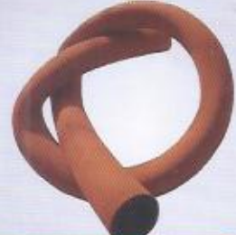
WINMAN hidrolik bezli su hortumu WINMAN medium pressure water hoses