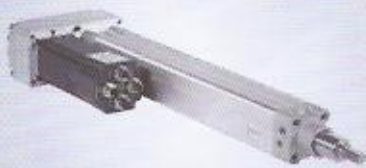
WINMAN lineer aktüatör WINMAN linear actuator