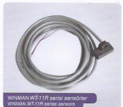
WINMAN WT-11R serisi sensörler WINMAN WT-11R series sensors