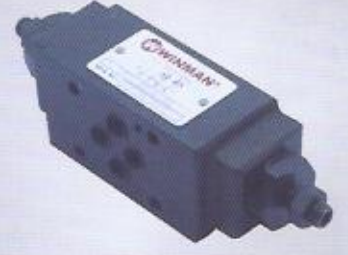
WINMAN modüler hız ayarlar WINMAN modular throttle valves