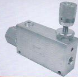
WINMAN üç yollu akış bölücü valfi WINMAN 3 ways flow divider valve