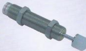
WINMAN sabit şok emiciler (SC) WINMAN shock absorber-SC series