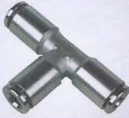
WINMAN metal TE bağlantı WINMAN union TEE