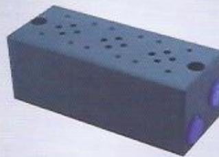
WINMAN valf bloklar WINMAN valve blocks