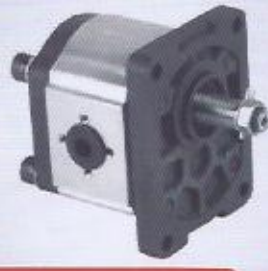
WINMAN grup 2 dişli pompalar WINMAN group 2 gear pumps