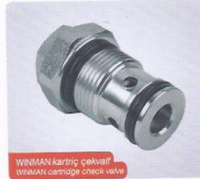
WINMAN kartrij çekvalf WINMAN cartridge check valve