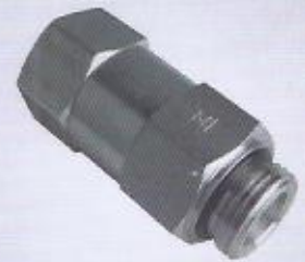
WINMAN hat tipi çekvalf WINMAN threaded type check valve