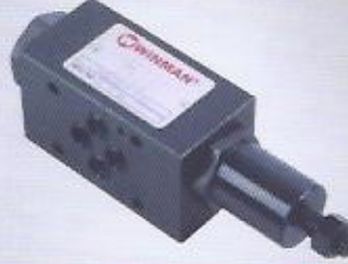
WINMAN modüler basınç düşürücüler WINMAN modular pressure reducing