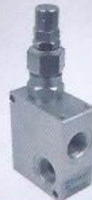
WINMAN hat tipi direkt emniyet valfi WINMAN in line type direct relief valve