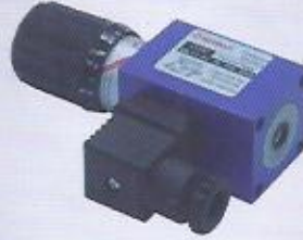
WINMAN WLP1 A1 basınç şalterleri WINMAN pressure switch WLP1 A1