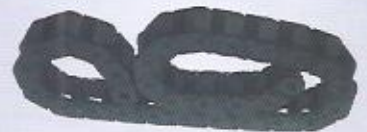
WINMAN kablo taşıyıcı sistemler WINMAN cable support systems