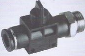
WINMAN HVSF dişli hortum vana WINMAN HVSF hand valve (thread-tube)