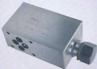
WINMAN modüler yük tutma tekli WINMAN modular overcenter