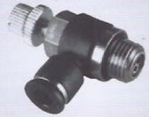
WINMAN dirsek hız ayar WINMAN elbow speed controller