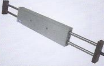
WINMAN STMB slide table silindirler WINMAN STMB slide table cylinders