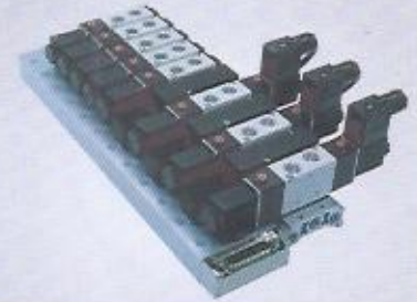
MCS200 serisi multi connector MCS200 series multi connector