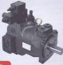
WINMAN PV hidrolik güç regülasyonu pistonlu pompalar hydraulic power compensated piston pumps