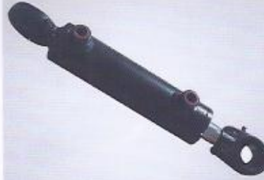
WINMAN hidrolik silindir WINMAN hydraulic cylinder