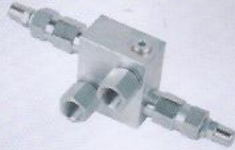
WINMAN hidromotor montajlı ikiz emniyet WINMAN double relief valve-flangeable on hydromotor