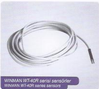
WINMAN WT-40R serisi sensörler WINMAN WT-40R series sensors