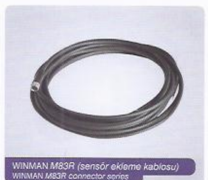
WINMAN M83R (sensör ekleme kablosu) WINMAN M83R connector series