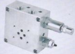
WINMAN modüler tandem sıfırlama valfi WINMAN modular tandem unloading valve