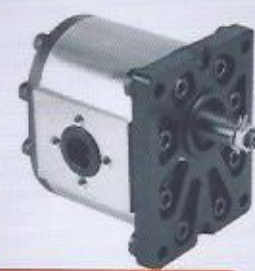
WINMAN grup 3 dişli pompalar WINMAN group 3 gear pumps