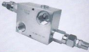
WINMAN hat tipi ikiz emniyet valfi WINMAN line type double relief valve