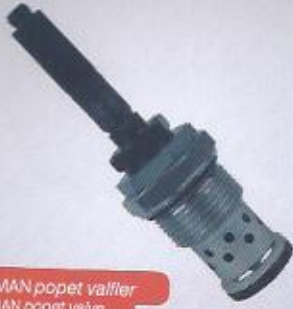
WINMAN popet valflier WINMAN popet valve