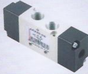
WINMAN hava - hava pnömatik valf WINMAN air-air pneumatic valves