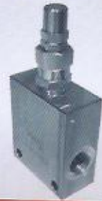
WINMAN basınç sıralama valfi WINMAN modular sequence valve