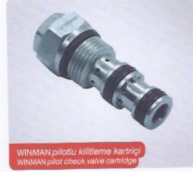
WINMAN pilotlu kilitleme kartrij WINMAN pilot check valve cartridge