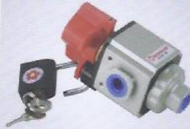
WINMAN kilitleli basınç emniyet valfieri WINMAN pressure relief valve