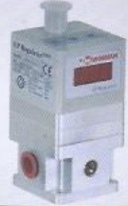
WINMAN W serisi pnömatik oransal regülatör W series pneumatic proportional regulator