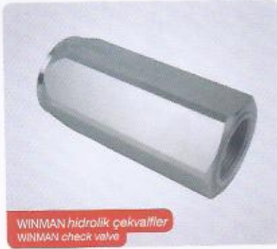
WINMAN hidrolik çekvalf WINMAN check valve