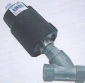
WINMAN paslanmaz pistonlu vanalar WINMAN stainless piston valve