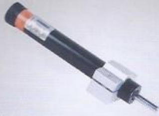
WINMAN hidrolik hız regülatörü WINMAN hydraulic speed regulator