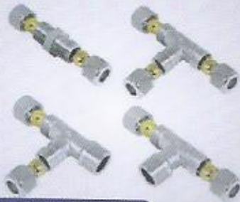
yüksüklü TE, yüksüklü nipel brass pneumatic cutting ring fitting TEE