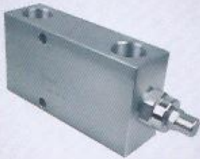
WINMAN hat tipi yük tutma tekli WINMAN in line overcenter valves