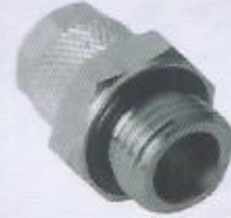
WINMAN IBC metal sıkmalı rekor bağlantılar WINMAN IBC male connector