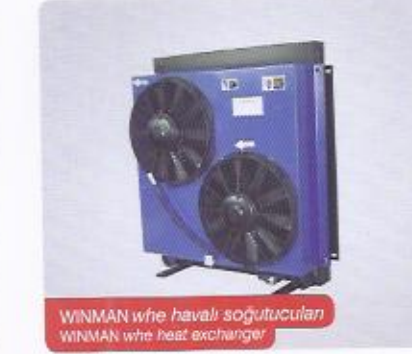
WINMAN whe havalı soğutucuları WINMAN whe heat exchanger