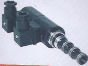
WINMAN 4-3 popet valf WINMAN 4-3 popet valf