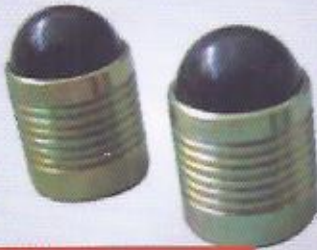
WINMAN delik körleme tapası WINMAN hole blanking plug