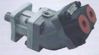
WINMAN axial pistonlu pompa WINMAN axial piston pump