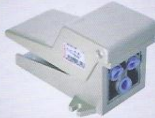
WINMAN pedal kumandalı pnömatik valf WINMAN foot pedal valves