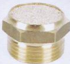
WINMAN BSLM serisi susturucular WINMAN BSLM series silencer