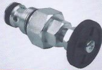
WINMAN hız ayar kartırcı WINMAN throttle cartridge