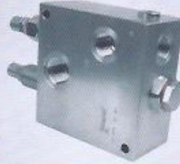
WINMAN hat tipi tandem sıfırlama valfi WINMAN in line tandem unloading valve