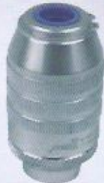
WINMAN valon tip hız ayar valfi WINMAN unidirectional flow valve