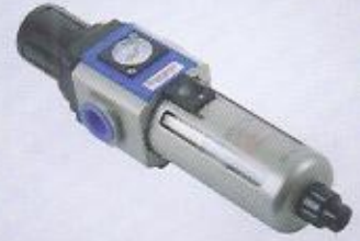
WINMAN filtre regülatör WINMAN filter regulator