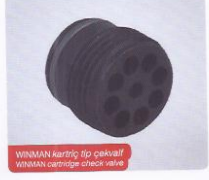
WINMAN kartrij tip çekvalf WINMAN cartridge check valve