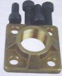
WINMAN pompa adaptörü WINMAN pump adaptor