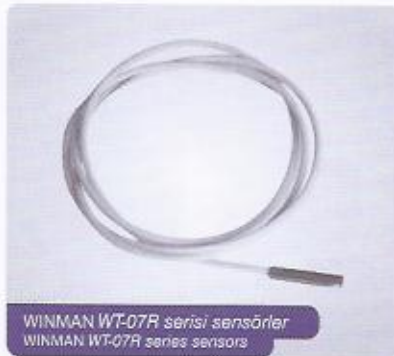
WINMAN WT-07R serisi sensörler WINMAN WT-07R series sensors