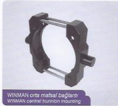
WINMAN orta mafsallı bağlantı WINMAN central trunnion mounting