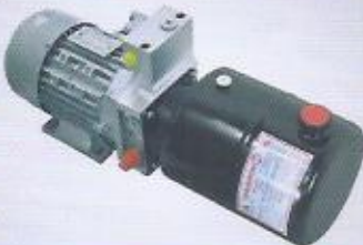
WINMAN AC-DC hidrolik power pack WINMAN AC-DC hydraulic power pack