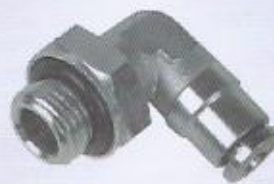
WINMAN metal dirsek bağlantı WINMAN swivel elbow