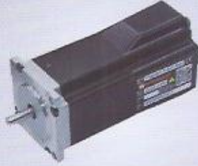
WINMAN step motor WINMAN stepper motors