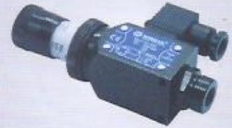
WINMAN WLP A3 basınç şalterleri WINMAN pressure switch WLP A3