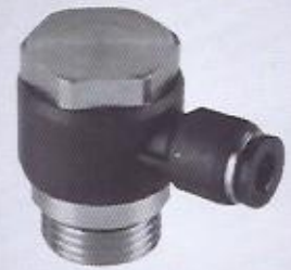
WINMAN tekli döner dirsek WINMAN male banjo