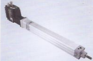
WINMAN lineer aktüatör WINMAN linear actuator