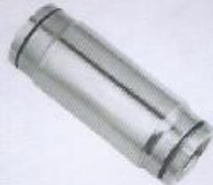
WINMAN paslanmaz nipel bağlantı WINMAN stainless union connector