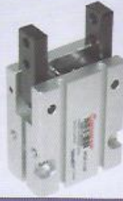
WINMAN pnömatik parmak tutucular WINMAN grippers