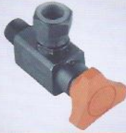
WINMAN manometre aç-kapa valfi haf tipi dirsek tip WINMAN inline type manometer on-off valve, elbow type