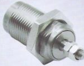
WINMAN WWD katırcı tip silindir WINMAN WWD cartridge type cylinder