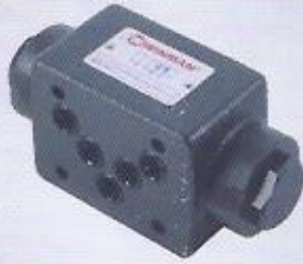
WINMAN modüler kilitlemeler WINMAN modular check valves