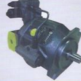
WINMAN WA10V hidrolik pistonlu pompa WINMAN WA10V hydraulic piston pump