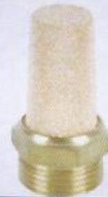
WINMAN BSL serisi susturucular WINMAN BSL series silencer