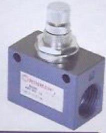
WINMAN hat tipi hız ayar valfleri WINMAN speed control valves