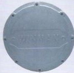
WINMAN depo bakım kapağı WINMAN overhaul cover