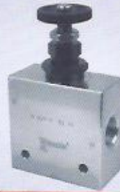
WINMAN 3 yollu basınç duyarlı hız ayar WINMAN 3 ways pressure compensated flow control