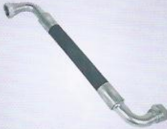
WINMAN hidrolik hortum (R1,R2,R9) WINMAN hydraulic hose (R1,R2,R9)