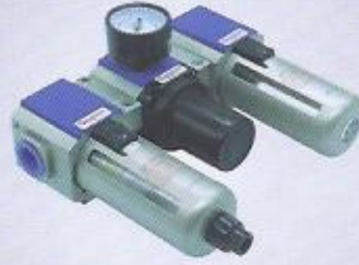
WINMAN üçlü şartlandırıcı WINMAN F.R.L combination