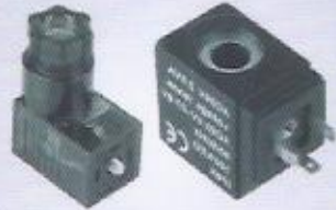
WINMAN selenoid bobin serisi ve din soket serisi WINMAN solenoid coil series and din connector series