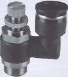
WINMAN 90° dirsek hız ayar WINMAN double elbow speed controller