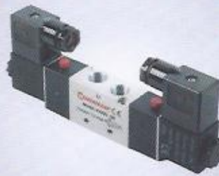
WINMAN çift bobin valfieri WINMAN double solenoid valves