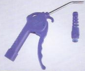
WINMAN hava tabancaları WINMAN air gun