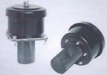
WINMAN havalandırma kapağı WINMAN air breather