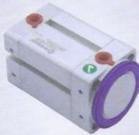
WINMAN manyetik tutucu silindir WINMAN magnetic gripper cylinder