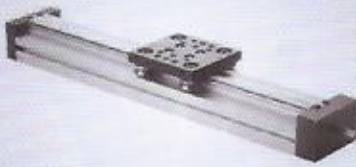
NL trapez vidalı ve bilyalı uygulama NL trapezoid screwed and ballscrewed