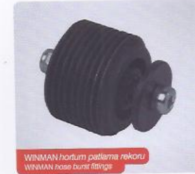
WINMAN hortum patlama rekoru WINMAN hose burst fittings