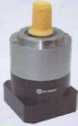
WINMAN dişli redüktör WINMAN gear reducers-WIE series