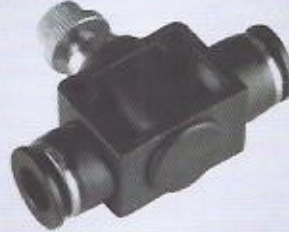
WINMAN hat tipi hız ayar bağlantı WINMAN speed control valves