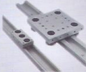
profil makara sistemi profil roller system