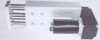
WINMAN lineer aktüatör WGCE serisi W/ Servo yönlendirmeli WINMAN linear actuators WGCE (guided W/ servo)