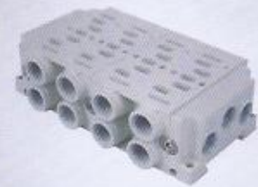
WINMAN ISO serisi manifoldlar WINMAN ISO series manifolds