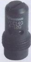
WINMAN sabit iniş kontrol valfi WINMAN fixed compensated load control valve