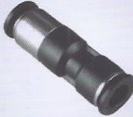
WINMAN nipel tipi çekvalf WINMAN union connector type check valve