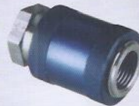
WINMAN HSV serisi kayar valf WINMAN HSV series hand slide valve