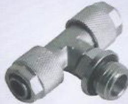
WINMAN IBT metal sıkmalı orta bacak TE WINMAN IBT union TE