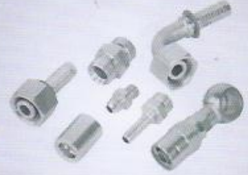
WINMAN hidrolik hortum rekorları WINMAN hydraulic hoses fittings