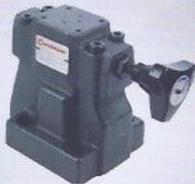
WINMAN pleyt tipi basınç emniyet valfi sıfırlama WINMAN solenoid controlled relief valve