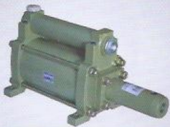
WINMAN booster WINMAN booster