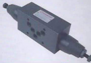
WINMAN modüler emniyetler WINMAN modular reliefs