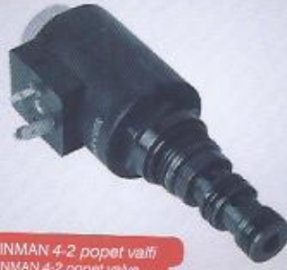
WINMAN 4-2 popet valfi WINMAN 4-2 popet valve