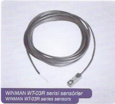
WINMAN WT-03R serisi sensörler WINMAN WT-03R series sensors