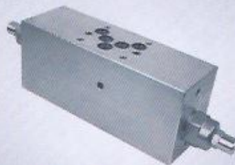
WINMAN modüler yük tutma ikiz WINMAN modular double overcenter