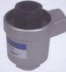
WINMAN çabuk egzost WINMAN speedy exhaust valves