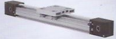
WINMAN kayış tutuculu uygulama WINMAN linear motion application