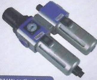
WINMAN şartlandırıcı WINMAN F.R.L combination