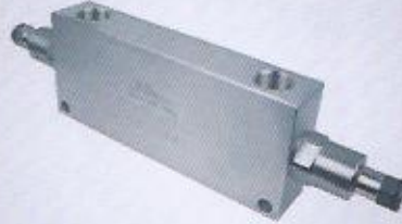
WINMAN hat tipi yük tutma ikiz WINMAN in line double overcenter