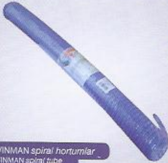
WINMAN spiral hortumlar WINMAN spiral tube