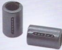
WINMAN bilyalı yataklar WINMAN ball bearing