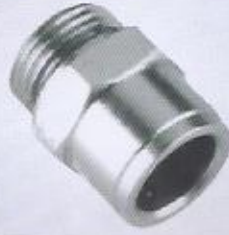
WINMAN paslanmaz bağlantı elemanları WINMAN stainless fittings