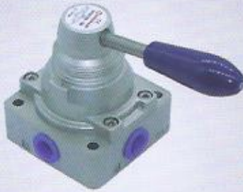
WINMAN 4HV230 serisi valf WINMAN 4HV230 series valve