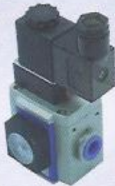
WINMAN yumuşak başlatma valfieri WINMAN soft start-up valve