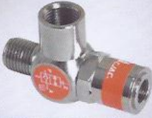
WINMAN hat tipi pilotlu kilitleme WINMAN piloted check valves