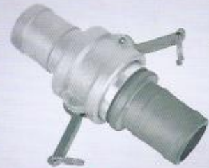
WINMAN kamlock WINMAN camlock