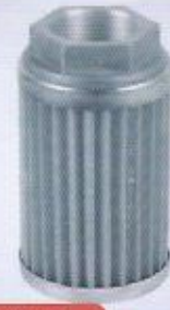
WINMAN emiş filtresi WINMAN suction filter