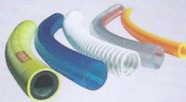
WINMAN çeşitli hortumlar WINMAN various hoses