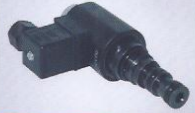
WINMAN 3-2 popet valfi WINMAN 3-2 popet valve