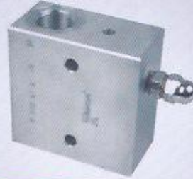
WINMAN popet gövdesi WINMAN popet block