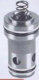
WINMAN lojik valfler WINMAN logic valves