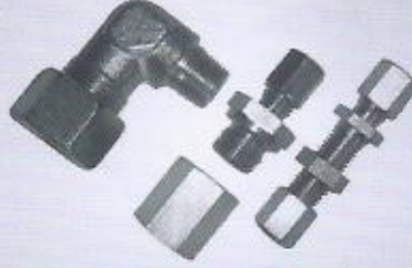
WINMAN hidrolik bağlantı elemanları WINMAN hydraulic fittings