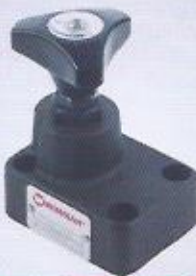
WINMAN modüler hız ayar valfi WINMAN modular throttle valve