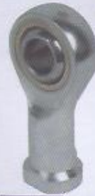
WINMAN manda gözü WINMAN P-shape joint