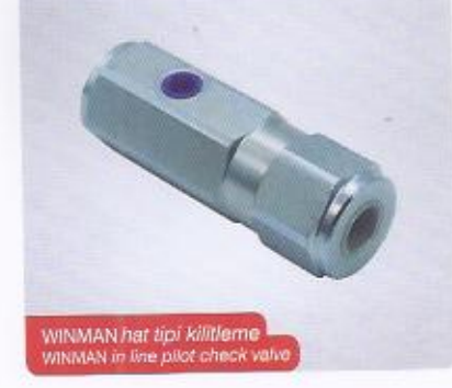
WINMAN hat tipi kilitleme WINMAN in line pilot check valve