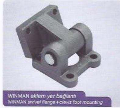
WINMAN ekleme yer bağlantı WINMAN swivel flange+clevis foot mounting