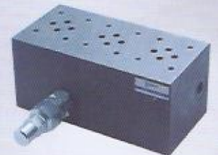
WINMAN emniyetli valf bloklar WINMAN valve blocks with relief valve