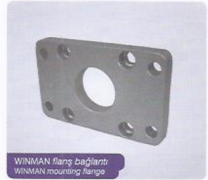
WINMAN flanş bağlantı WINMAN mounting flange