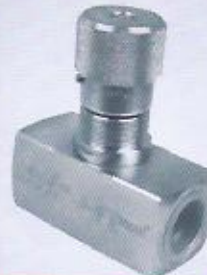
WINMAN hat tipi hız ayar valfi WINMAN in line throttle valve