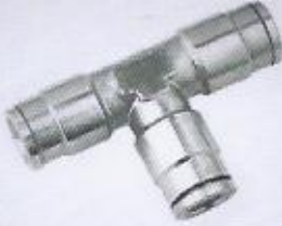
WINMAN paslanmaz TE bağlantı WINMAN stainless union TEE