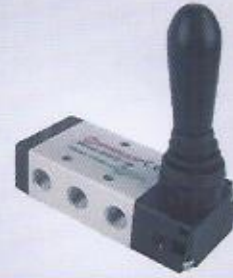
WINMAN kol kumandalı pnömatik valf WINMAN hand lever pneumatic valves