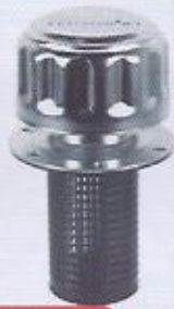
WINMAN depo kapağı WINMAN tank cap