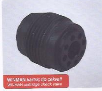
WINMAN kartrij tip çekvalf WINMAN cartridge check valve