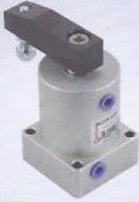
WINMAN ACK seri klamp WINMAN ACK series clamps