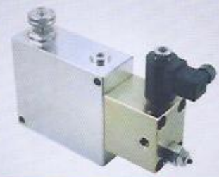
WINMAN hidrolik kırıcı valfler WINMAN priority flow control combination valve