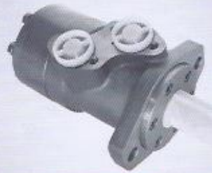
WINMAN hidromotorlar WINMAN hydromotors