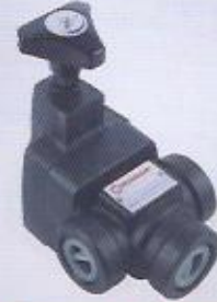
WINMAN hat tipi basınç emniyet valfi WINMAN in line relief valve