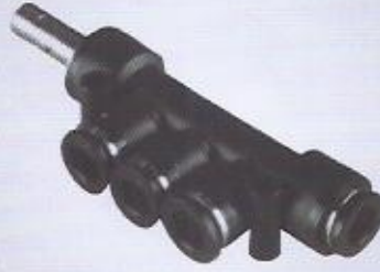
WINMAN kollektör bağlantı WINMAN reducer triple branch union