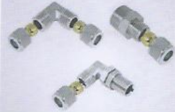
yüksüklü rekor, yüksüklü dirsek brass pneumatic cutting ring fitting elbow