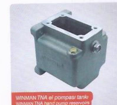
WINMAN TNA el pompası tankı WINMAN TNA hand pump reservoir