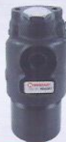
WINMAN basınç filtresi WINMAN pressure filter