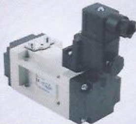
WINMAN ISO serisi pnömatik valfieri WINMAN ISO series pneumatic valves