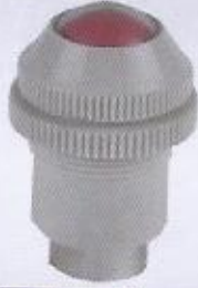
WINMAN basınç gözü WINMAN visual indicator