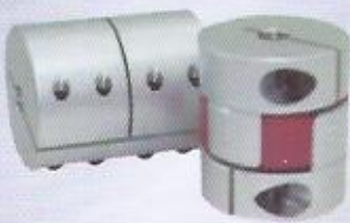
WINMAN servo kaplin WINMAN servo couplings