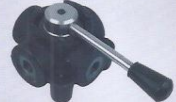
WINMAN 3 yollu küresel vana WINMAN 3 ways valve ball valve