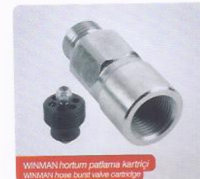
WINMAN hortum patlama kartrij WINMAN hose burst valve cartridge