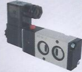
WINMAN namur pnömatik valfieri WINMAN namur valves