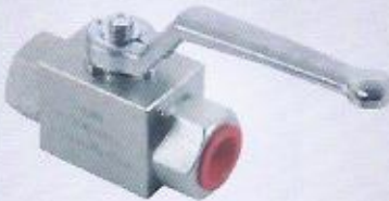
WINMAN KHB hidrolik küresel vana 2 yollu WINMAN 2 ways valve ball valve KHB