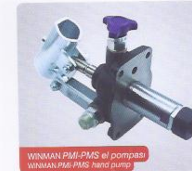
WINMAN PMI-PMS el pompası WINMAN PMI-PMS hand pump