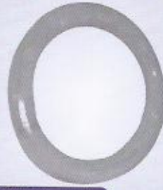
WINMAN teflon hortumlar WINMAN teflon tubes