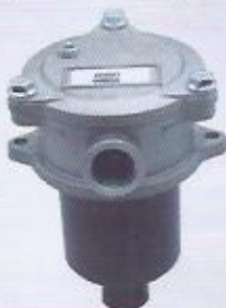
WINMAN dönüş filtresi WINMAN filter