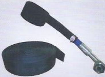
WINMAN tekstil örgülü polyester kılıf (MSHA onaylı) textile braided polyester case (MSHA approved)