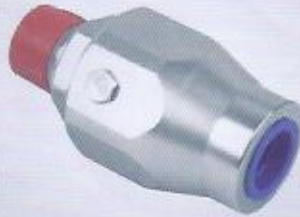
WINMAN döner elemanlar WINMAN rotating union