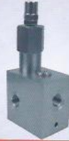
WINMAN hat tipi basınç düşürücü WINMAN line type pressure reducing valve