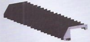
körük uygulamaları bellows applications