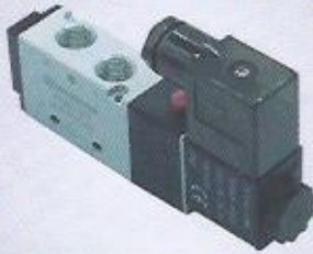
WINMAN tek bobin valfieri WINMAN single solenoid valves