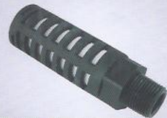
WINMAN ST serisi susturucular WINMAN ST series silencer