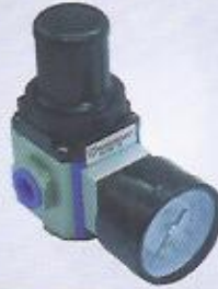
WINMAN regülatör WINMAN regulator