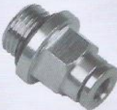
WINMAN metal rekor bağlantı WINMAN male connector