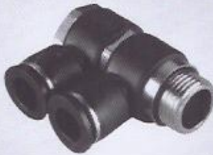
WINMAN ikili döner dirsek WINMAN double universal elbow