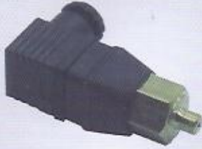
WINMAN PP basınç şalterleri WINMAN pressure switch PP