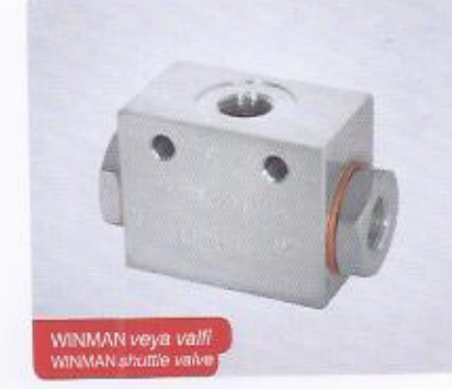
WINMAN veya valfi WINMAN shuttle valve