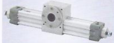
WINMAN WRC aktüatör WINMAN WRC actuator