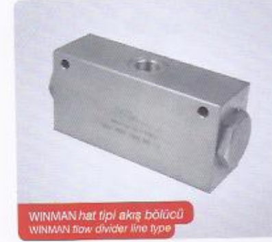
WINMAN hat tipi akış bölücü WINMAN flow divider line type