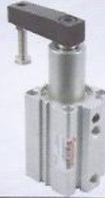
WINMAN AS1 seri döner klamp WINMAN AS1 series clamp