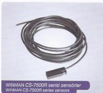
WINMAN CS-7500R serisi sensörler WINMAN CS-7500R series sensors