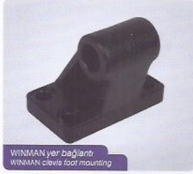
WINMAN yer bağlantı WINMAN clevis foot mounting