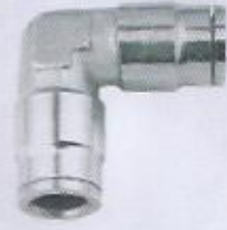
WINMAN paslanmaz dirsek bağlantı WINMAN stainless union elbow