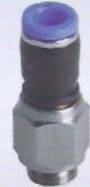
WINMAN NRC yüksek hızlı döner rekor WINMAN NRC high speed male swivel connector