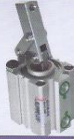
WINMAN AS4 seri klamp WINMAN AS4 series clamps