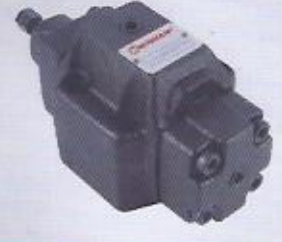
WINMAN modüler emniyet ve karşı denge valfi WINMAN modular relief and overcenter valve