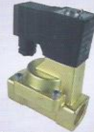
WINMAN 2W serisi selenoid valf WINMAN 2W series solenoid valve