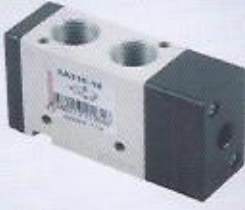
WINMAN hava - yay pnömatik valf WINMAN air-spring pneumatic valves