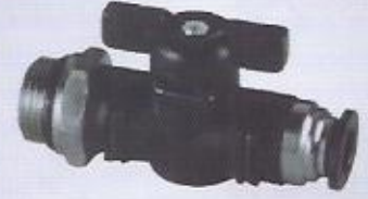
WINMAN BVU küresel vana WINMAN BVU union