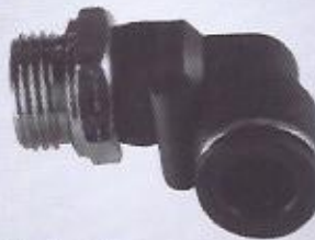
WINMAN dirsek bağlantı WINMAN male elbow