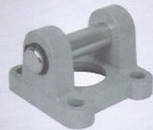
WINMAN eklem bağlantı WINMAN swivel flange