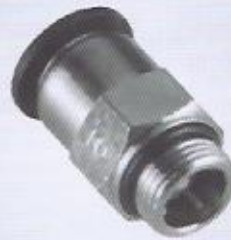
WINMAN stop rekor WINMAN stop connector