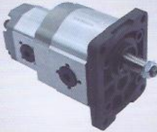
WINMAN dişli tandem pompa WINMAN tandem gear pump