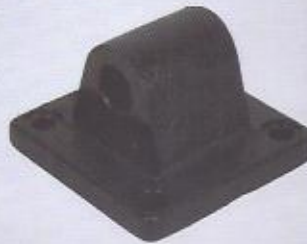
WINMAN CA eklem bağlantı WINMAN CA swivel flange