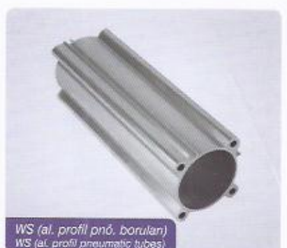
WS (al. profil pnö. boruları) WS (al. profil pneumatic tubes)