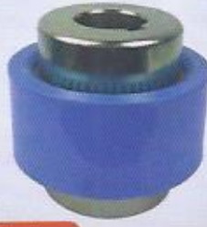
WINMAN kaplin WINMAN coupler