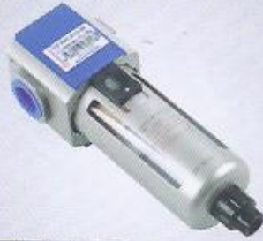
WINMAN filtre WINMAN filter