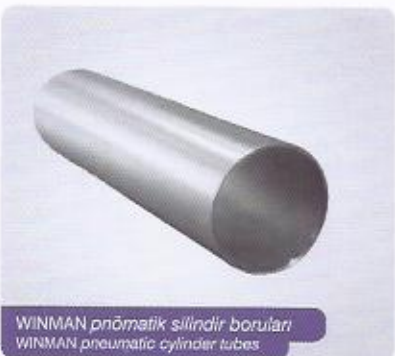
WINMAN pnömatic silindir boruları WINMAN pneumatic cylinder tubes