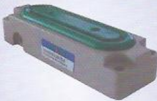
WINMAN yassı diyafram silindir WINMAN clamping module cv