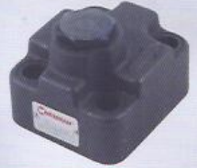
WINMAN modüler çekvalf WINMAN modular check valves