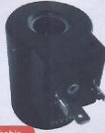
WINMAN bobin WINMAN coil