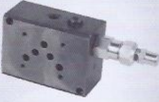
WINMAN NG10 tekli emni çelik valf pleytleri WINMAN NG10 valve manifolds