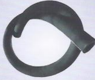
WINMAN hidrolik bezli hava hortumu WINMAN industrial type air hoses