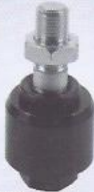
WINMAN kasıntı alıcı WINMAN float connect