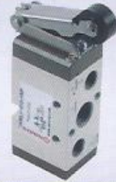
WINMAN mekanik kontrollü pnömatik valf WINMAN mechanically pneumatic control valves