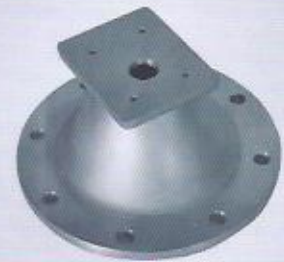
WINMAN kampa WINMAN bell