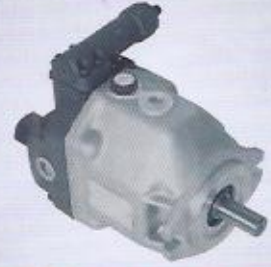
WINMAN değişken debili axial pistonlu pompalar WINMAN variable axial displacement piston pump