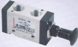
WINMAN çekmeli pnömatik valf WINMAN push-pull pneumatic valves