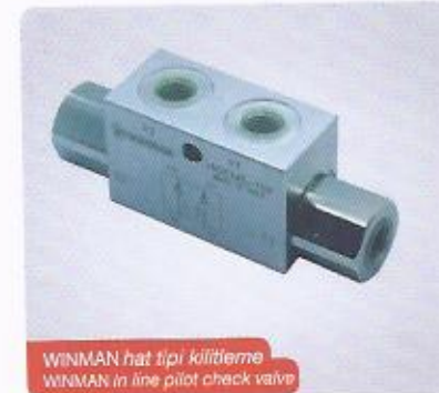
WINMAN hat tipi kilitleme WINMAN in line pilot check valve