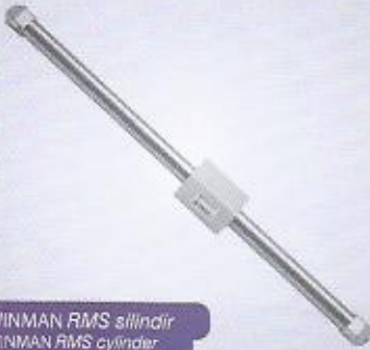
WINMAN RMS silindir WINMAN RMS cylinder