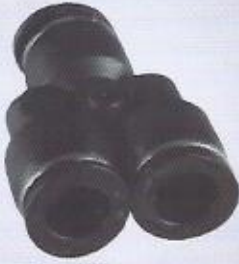
WINMAN YE bağlantı WINMAN union Y