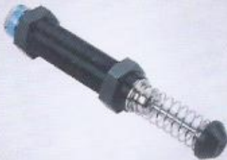
WINMAN ayarlanabilir şok emiciler (FC) WINMAN shock absorber FC series