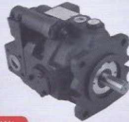
WINMAN değişken debili axial pistonlu pompalar-v serisi variable axial displacement piston pump-v series