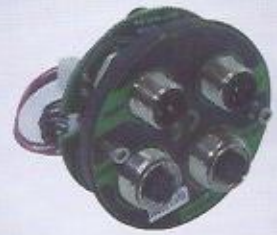
WINMAN endüstriyel iletişim modülü WINMAN industrial communication modul