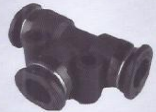
WINMAN TE bağlantı WINMAN union TEE