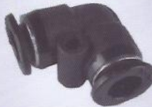
WINMAN dirsek bağlantı WINMAN male elbow