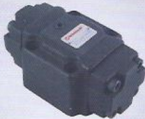
WINMAN modüler pilotlu kilitleme WINMAN pilot check valves