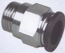
WINMAN rakor bağlantı WINMAN male straight