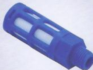
WINMAN PSU serisi susturucular WINMAN PSU series silencer