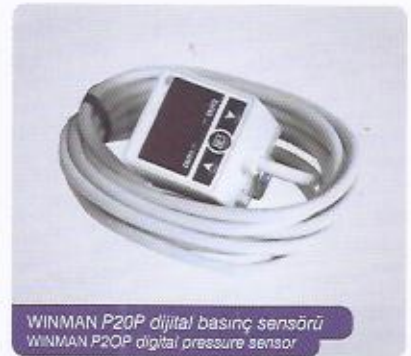
WINMAN P20P dijital basınç sensörü WINMAN P20P digital pressure sensor