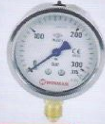
WINMAN manometreler WINMAN pressure gauge