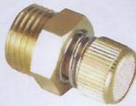
WINMAN eğsoz kısıcısı-ISD WINMAN speed controller silencer