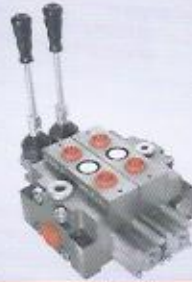
WINMAN hidrolik kumanda kolları WINMAN hydraulic control lever