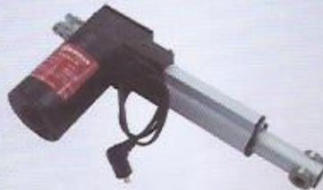
WINMAN lineer aktüatör (W-DC motor)WEKS serisi WINMAN linear actuators (W-DC motor) - WEKS series