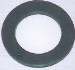
WINMAN depo içi mıknatıs WINMAN magnet, in tank type