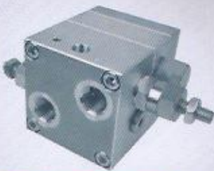
WINMAN motor tipi yük tutma WINMAN motor type overcenter