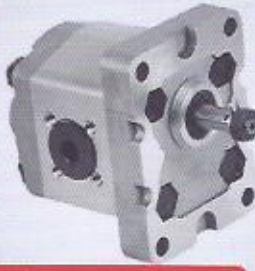
WINMAN grup 1 dişli pompalar WINMAN group 1 gear pumps