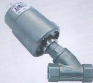
WINMAN komple paslanmaz pistonlu vana WINMAN whole body stainless piston valve