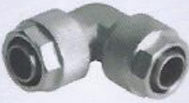
WINMAN IBV metal sıkmalı dirsek bağlantılar WINMAN IBV swivel elbow