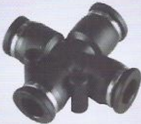
WINMAN kruva bağlantı WINMAN cross connector