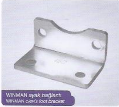
WINMAN ayak bağlantı WINMAN clevis foot bracket