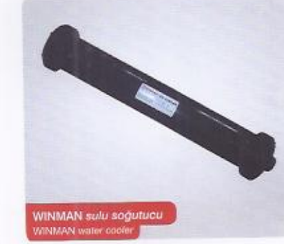
WINMAN sulu soğutucu WINMAN water cooler