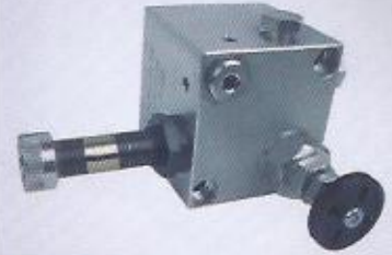
WINMAN hat tipi platform valfi WINMAN in line platform valves