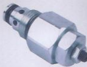
WINMAN kartriç emniyet valfieri WINMAN cartridges relief valve