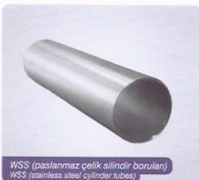
WSS (paslanmaz çelik silindir boruları) WSS (stainless steel cylinder tubes)