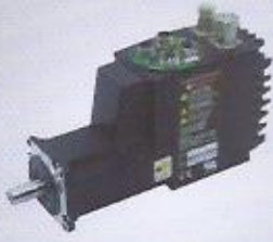
WINMAN servo motor WINMAN servo motors