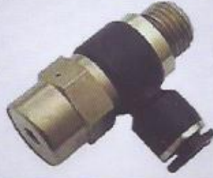
WINMAN pnömatik pilotlu kilitleme WINMAN pneumatic pilot locking