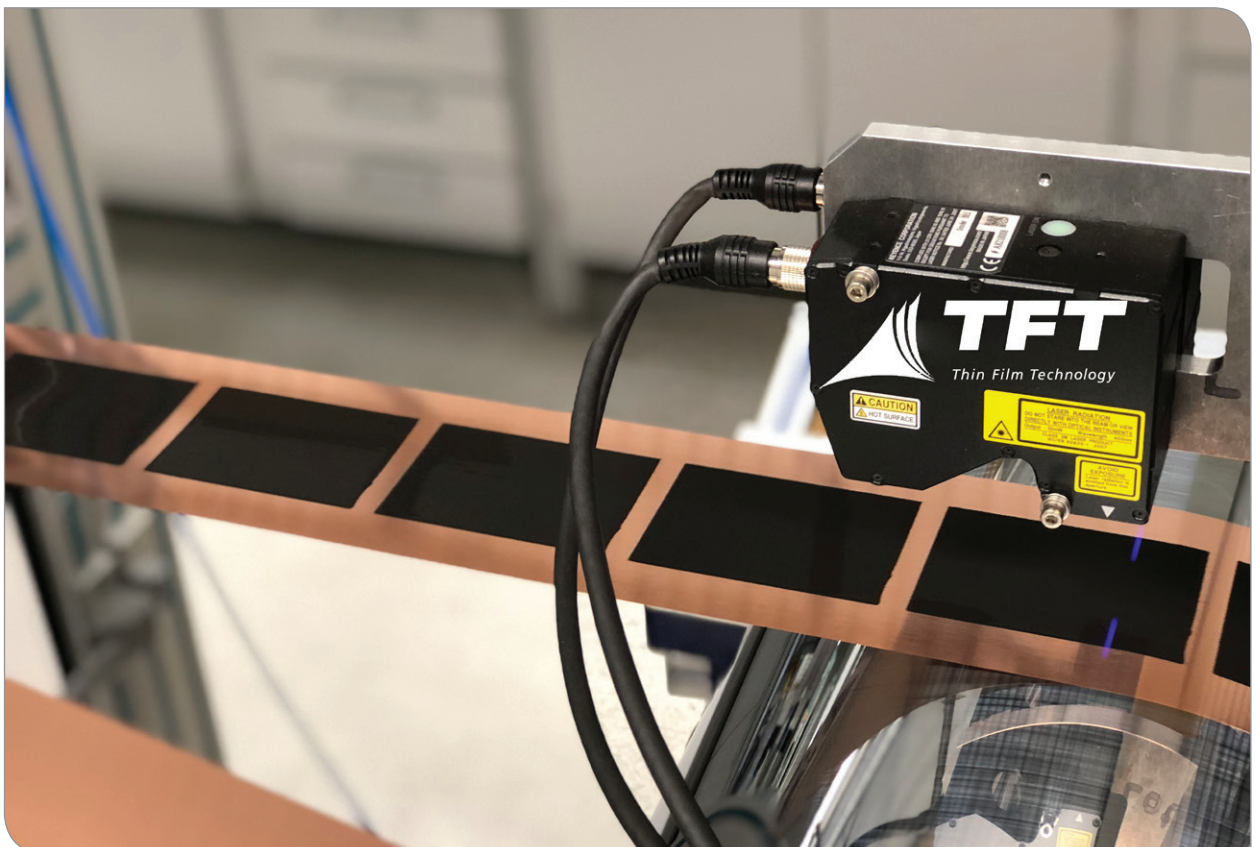
Inlinevermessung der Elektroden sichert höchste Qualität.

Intermittierende Elektrodenmuster sind aus der Batterie-fertigung bereits bekannt: Zwischen den beschichteten Abschnitten liegt dabei jeweils ein Streifen unbeschichteter Folie, der als Elektrodenableiter dient. Die Wissenschaftler der Forschungsgruppe Thin Film Technology (TFT) des Instituts für Thermische Verfahrenstechnik (TVT) am KIT haben ein zum Patent angemeldetes Verfahren entwickelt, das die Fertigung intermittierender Elektrodenfolien beschleunigt und dabei hochpräzise arbeitet. Der Start- und Stopp-kantenverlauf der Beschichtung, der für eine zuverlässige Funktionsweise der Akkus entscheidend ist, konnte dabei sogar verbessert werden. Der entscheidende Kniff ist dabei die Entwicklung einer neuartigen Düse, die mit einer speziellen Membran ausgestattet ist. Diese ist in der Lage