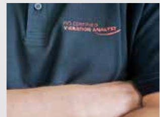
Service & Support

Lasermesssysteme und Dienstleistungen zur optimalen Ausrichtung von Maschinen und Anlagen.