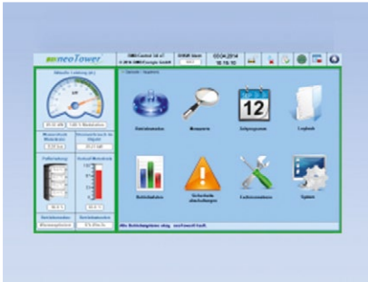
Das Display des neoTower® PREMIUM L