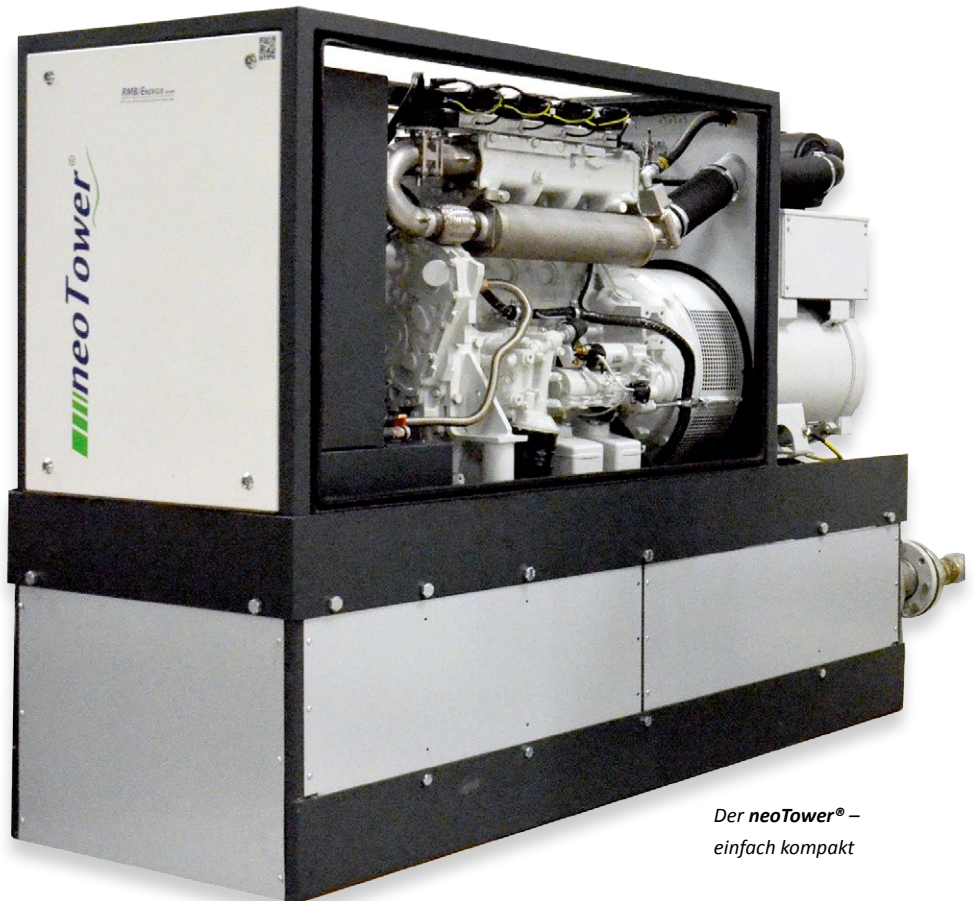
Der neoTower® – einfach kompakt

An diesem 10,1" -Farbmonitor lassen sich alle wichtigen Temperaturen, Betriebszustände, Laufzeiten und Trends des BHKW ablesen. Auch Einstellungen zum Zeitprogramm, zur Leistungsvorgabe oder der Steuerung des Spitzenlastkessels lassen sich bequem über den Touchscreen vornehmen.