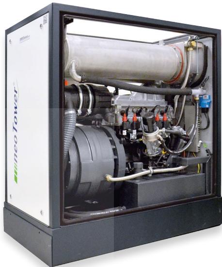
Der neoTower® – einfach kompakt