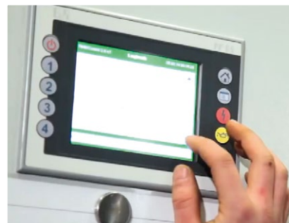
Ganz einfach – die Bedienung des neoTower®