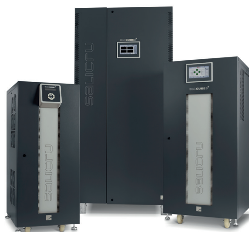
SLC CUBE3 +