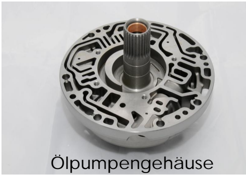
Ölpumpengehäuse Oil pump housing