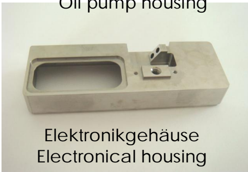
Elektronikgehäuse Electrical housing