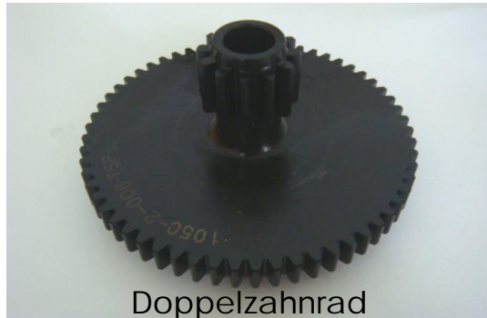
Doppelzahnrad Double gear