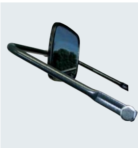
Zubehör: SHS S8 / S10 Spiegel - für die bessere Sicht auf Ihr Werkstück