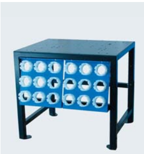
Zubehör: TU-Rack 18PB239 TU Rack - Arbeitstisch inkl. 18-teiliger Backen Ablage