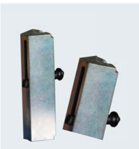
Zubehör: PTS 52 - markieren und pressen in einem Arbeitsgang; gemäß DIN 20066, EN 853, EN 856, EN 857