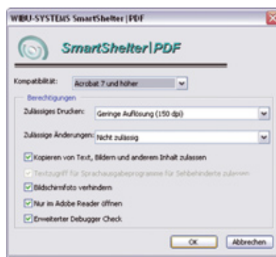
Setzen von Berechtigungen im verschlüsselten Dokument