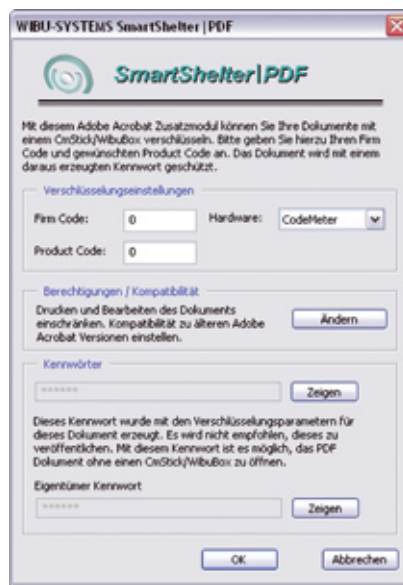
Dialog zum Verschlüsseln von Dokumenten

Der Leser öffnet das PDF-Dokument wie gewohnt mit dem Adobe Reader. Wird ein CmStick mit dem passenden Lizenzintrag gefunden, kann das PDF-Dokument geöffnet werden. Verfügt der Leser über keinen CmStick, öffnet sich ein Passwort-Dialog.