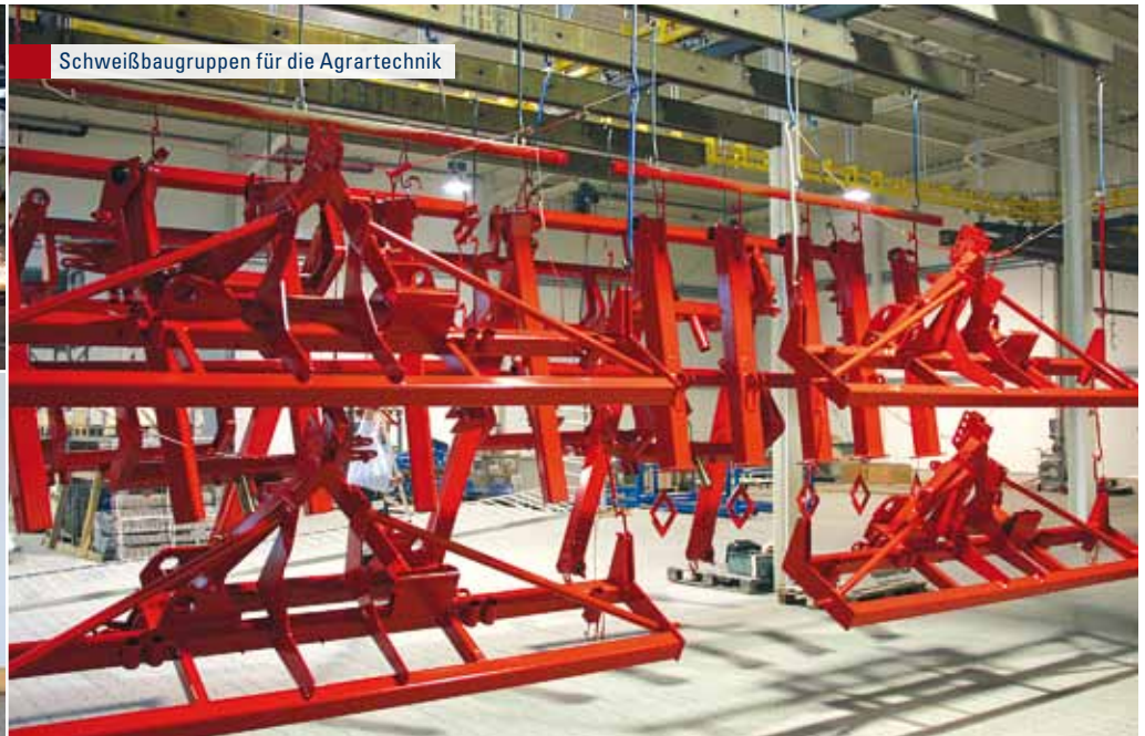
Schweißbaugruppen für die Agrartechnik