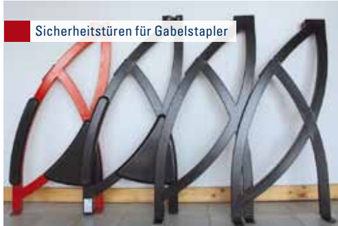
Sicherheitstüren für Gabelstapler