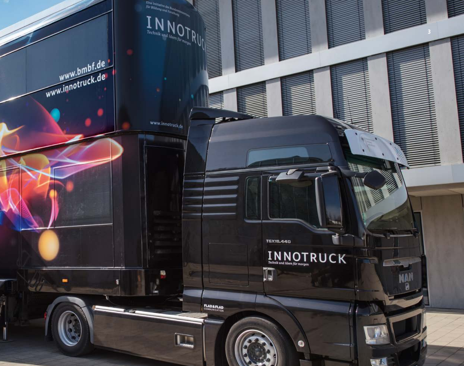
Tourt als „Innovations-Botschafter“ des BMBF durch Deutschland: der InnoTruck.

Damit wir diesen Weg auch weiterhin erfolgreich beschreiten können, müssen wir die Rolle Deutschlands als Innovationsführer im internationalen Wettbewerb stärken. Die Bundesregierung hat daher die neue Hightech-Strategie ins Leben gerufen. Sie sorgt dafür, dass die Bedingungen in Deutschland innovationsfreundlich bleiben. Auch weil damit Zukunftstechnologien und die Umsetzung von Forschungsergebnissen in alltags- und nutzenorientierte Lösungen gefördert werden. Nur so können wir die anstehenden Zukunftsaufgaben zum Wohle unserer Gesellschaft und Gemeinschaft bewältigen.