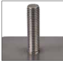
Kleiner, gleichmäßiger spritzerfreier Schweißwulst

The PH-9 SRM 12 is the standard gun for the SOYER BMK-8i ACCU