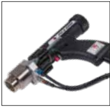
Die Schweißpistole PH-9 SRM 12 ist die Standardpistole für das SOYER BMK-8i ACCU

The PH-9 SRM 12 is the standard gun for the SOYER BMK-8i ACCU