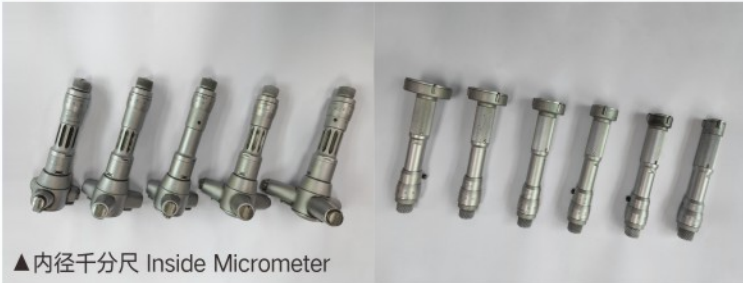
▲内径千分尺 Inside Micrometer