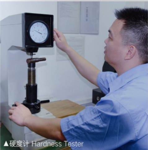
▲硬度计 Hardness Tester