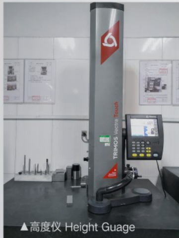
▲高度仪 Height Guage