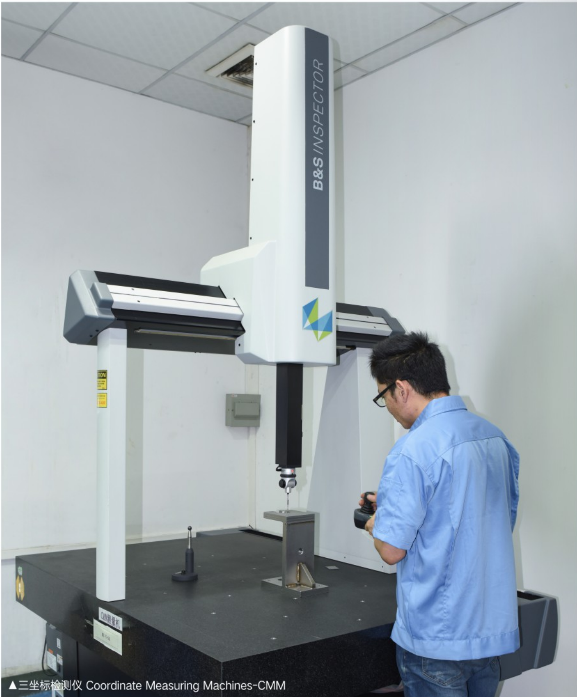
▲三坐标检测仪 Coordinate Measuring Machines-CMM