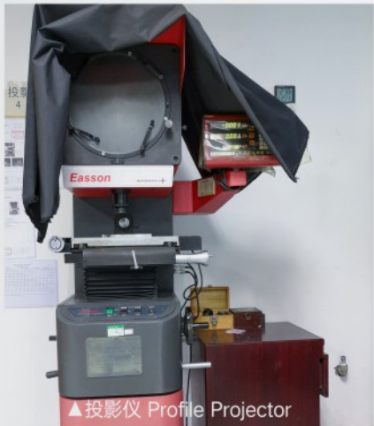
▲投影仪 Profile Projector