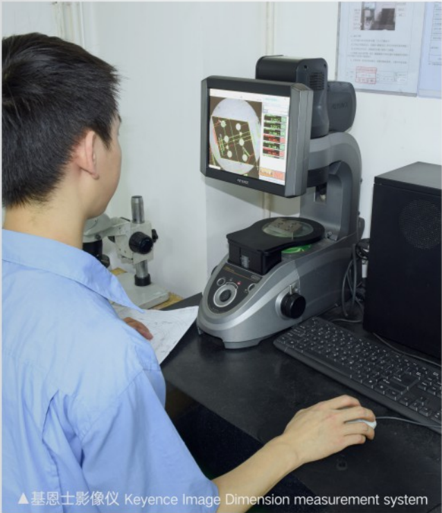
▲基恩士影像仪 Keyence Image Dimension measurement system