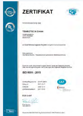
Zertifikat DIN ISO 9001 : 2015