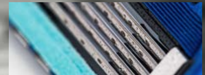
Konsum- & Investitionsgüter