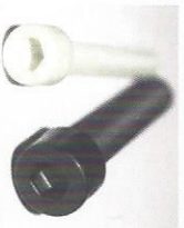
WT-Zylinderschrauben mit Innensechskant