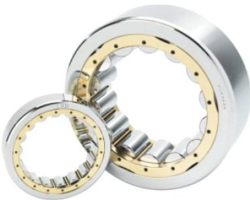
Zylinderrollenlager cylindrical roller bearings