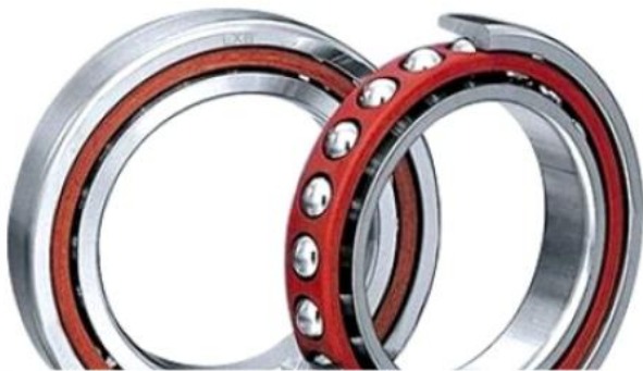
Schräggugellager angular contact ball bearings