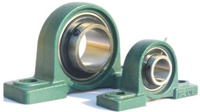
Flansch- und Spannlager mit Gehäuseeinheit pillow block bearings with housing unit