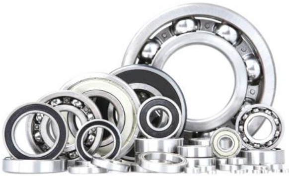
Ein- und zweireihige Rillenkugellager single and double row deep groove ball bearings