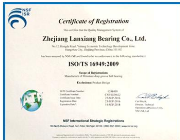
ISO / TS 16949:2009