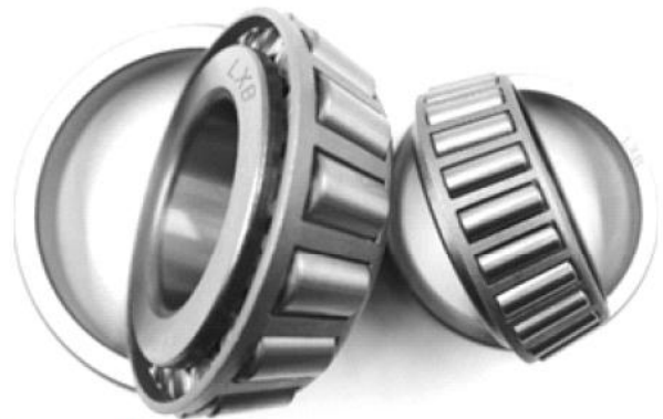
Kegelrollenlager tapered roller bearings