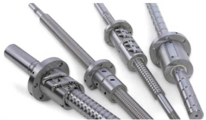
Stützlager für Kugelwindetriebe supporting bearings for ball screw drives

LXB produziert Speziallager nach Zeichnung, die sich in Abmessung, Funktion und Material (Keramik, Edelstahl, Hybrid) unterscheiden.