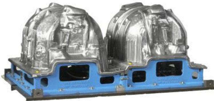
Formwerkzeug für textile Radlaufschaale