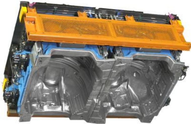
Stanzwerkzeug für textile Radlaufschaale