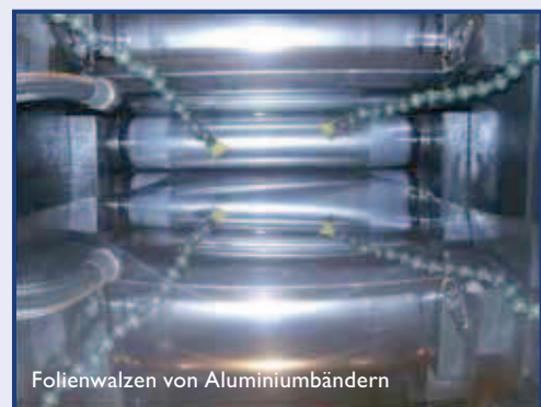
Folienwalzen von Aluminiumbändern

Stellen Sie uns Ihre Fragen zur Keramik. - Wir finden Lösungen!