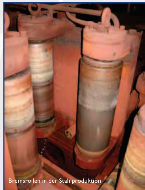
Bremsrollen in der Stahlproduktion