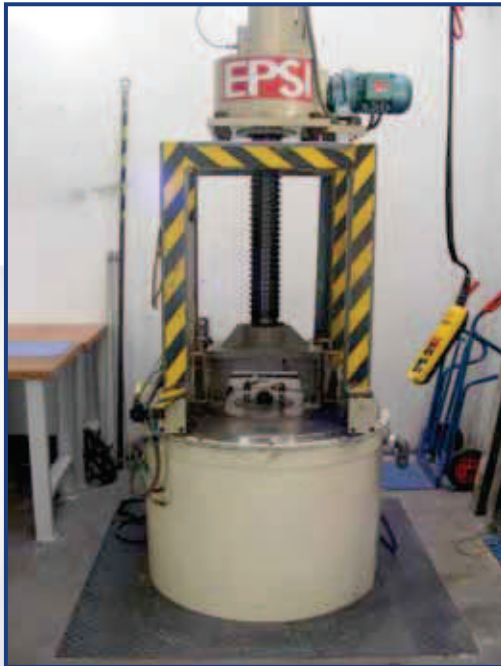
Heißisostatische Presse (HIPe)

Tel: +49 (0) 3 67 66 / 8 68 - 0 Fax: +49 (0) 3 67 66 / 8 68 - 68 info@fcti.de