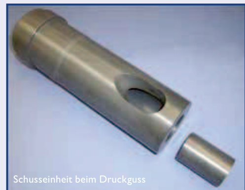
Schusseinheit beim Druckguss

Stellen Sie uns Ihre Fragen zur Keramik. - Wir finden Lösungen!