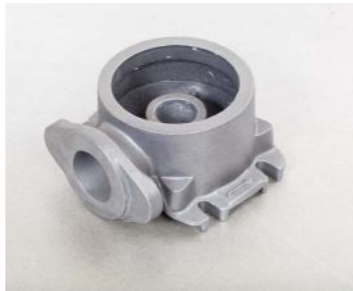
GG-20 (6 Kg)