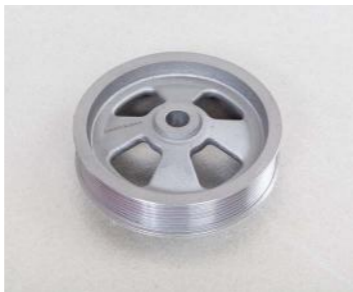
GGG-40 (3 Kg)