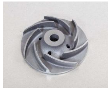
GG-20 (1 Kg)