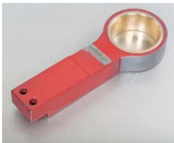
GS-52 (20 Kg)