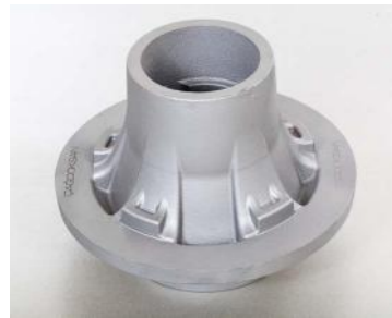
GGG-50 (40 Kg)