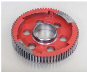
GS-52 (50 Kg)