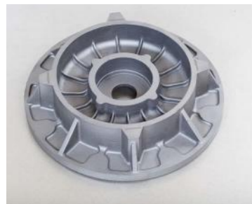
GG-30 (35 Kg)