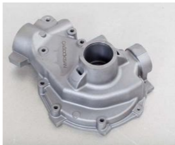
GG-20 (9 Kg)