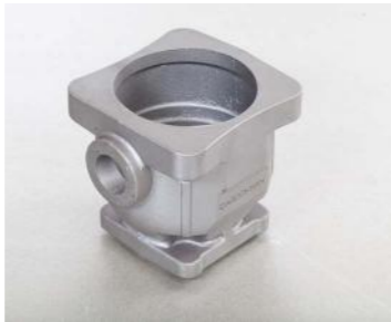
GGG-50 (7 Kg)