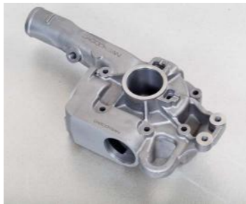
GG-20 (9 Kg)