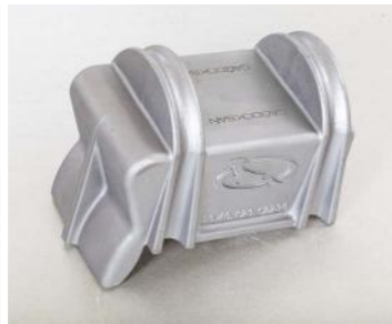
GGG-50 (15 Kg)