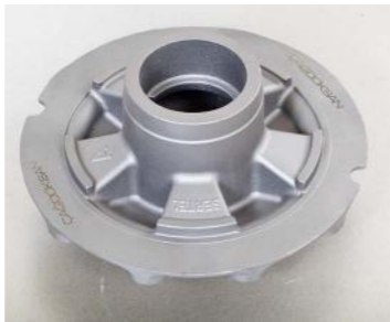
GGG-50 (25 Kg)