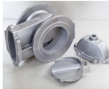
GGG-50 (40 Kg)