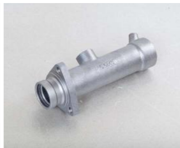
GG-20 (3 Kg)