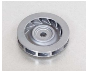
GG-20 (1 Kg)