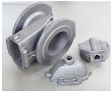
GGG-50 (20 Kg)