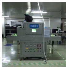
「UV Curing Machine」