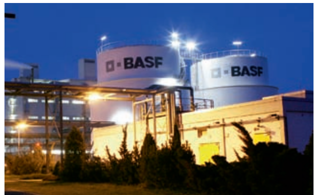
Werksansicht der BASF Schwarzheide GmbH in Schwarzheide

Die Arbeitskosten in der Industrie in Ostdeutschland liegen im internationalen Standortvergleich in einer Gruppe mit Japan, Italien und Spanien, während die Arbeitskosten im Westen Deutschlands nach Norwegen und Dänemark an der Spitze liegen.