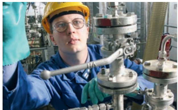
Chemikant im Technikum der BASF Schwarzheide GmbH in Schwarzheide

Fast 17.000 Spezialisten arbeiten gegenwärtig in mehr als 100 Unternehmen der Chemiebranche in Berlin und Brandenburg. Auch an qualifiziertem Nachwuchs herrscht kein Mangel: Rund 3.000 Studenten studieren Chemie an einer der Universitäten und Fachhochschulen der Hauptstadtregion, deren Ausbildungsqualität im deutschlandweiten Vergleich mit Bestnoten bewertet wird.