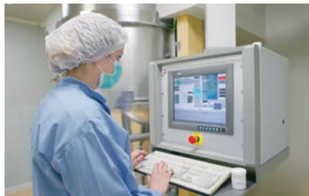
Prozesskontrolle im Rahmen der Feststoffherstellung bei der Berlin Chemie AG in Berlin

In Forschung und Entwicklung ist Berlin-Brandenburg sowohl quantitativ als auch qualitativ ein Schwergewicht in Europa: 11 Universitäten, 17 Fachhochschulen mit mehr als 180.000 Studenten sowie über 250 private und öffentliche Institute bilden ein dichtes Netzwerk praxisnaher Infrastruktur, von denen Chemieunternehmen profitieren. Mit dem Fraunhofer Institut für angewandte Polymerforschung sowie der Außenstelle des Fraunhofer Instituts für Zuverlässigkeit und Mikrointegration verfügt Brandenburg über renommierte Einrichtungen mit Kunststoff-Kompetenz. Moderne Chemsites und Verbundstandorte, z.B. in Schwarzheide und Schwedt, fördern den Technologietransfer und verschaffen wirtschaftliche Vorteile.