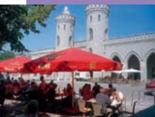
Nauener Tor in Potsdam