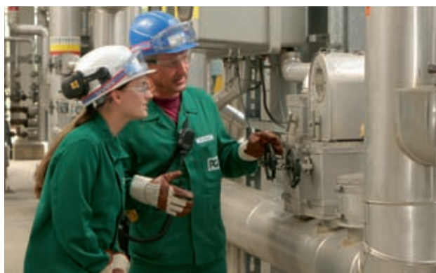
Mitarbeiter der PCK Raffinerie GmbH in Schwedt/Oder

Dynamisches Wachstum und ein innovationsfreudiges Klima prägen die Chemiebranche der Hauptstadtregion. Derzeit beschäftigt die Branche mehr als ein Drittel aller in Chemieunternehmen Ostdeutschlands tätigen Mitarbeiter. Die Chemie- und Kunststoffunternehmen der Region erwirtschafteten 2006 einen Umsatz von rund 6,7 Mrd. Euro. Sie repräsentieren die gesamte Wertschöpfungskette – von Kunststoffen über Chemiefasern bis zu Arzneimitteln. Die Region stärkt ihre Rolle als europäisches Kompetenzzentrum der Chemieindustrie.