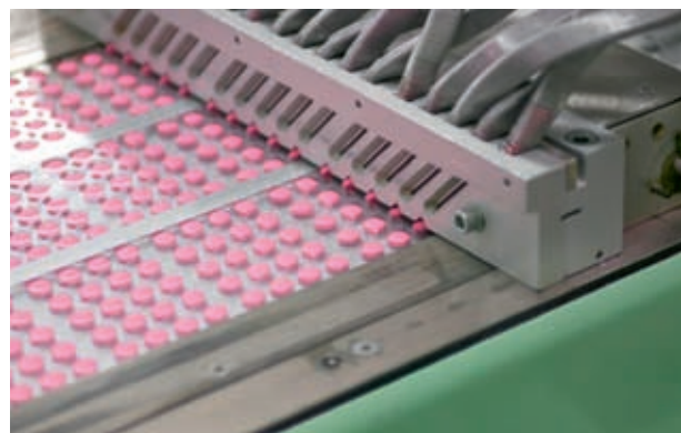
Verblisterung von Tabletten, Berlin Chemie AG in Berlin