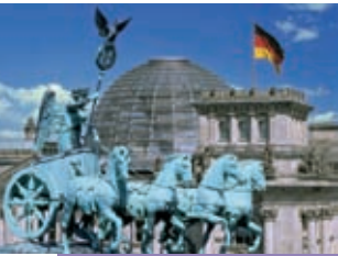
Quadriga des Brandenburger Tors vor der Reichstagskuppel

Titel: PCK Raffinerie GmbH, Schwedt/Oder: Harald Hirsch Werksansicht BASF Schwarzheide GmbH: BASF Schwarzheide GmbH Technikum: BASF Schwarzheide GmbH Mitarbeiter der PCK Raffinerie GmbH, Schwedt Prozesskontrolle: Berlin Chemie AG Verblisterung: Berlin Chemie AG Reichstagskuppel: Berlin Partner GmbH/FTB-Werbefotografie Schloss Sanssouci: Ministerium für Wirtschaft des Landes Brandenburg Segelschiffe auf der Havel: Boettcher/TMB-Fotoarchiv Nauener Tor: Ministerium für Wirtschaft des Landes Brandenburg/Hoffmann