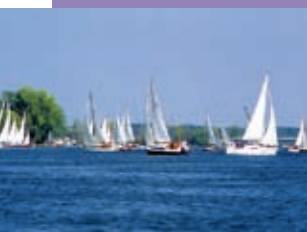
Hervorragende Freizeitmöglichkeiten in der Region