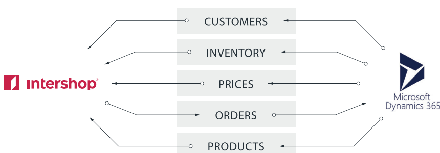
Intershop Commerce und Microsoft Dynamics 365 Connector

In Kombination mit Microsoft Dynamics 365 bietet Intershop Unternehmen die Möglichkeit, E-Commerce integriert mit dem Management des kompletten Kundenlebenszyklus' kanalübergreifend profitabel auszurichten und ihre unternehmerischen Visionen flexibel in der Cloud umzusetzen. Schritt für Schritt. Zukunftsorientiert.