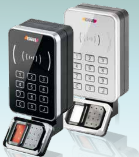
IT 4210 FP