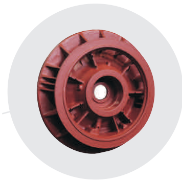
Flanschlagerschild 96 kg, EN-GJL-200