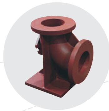
Einlaufkrümmer 35 kg, EN-GJL-250