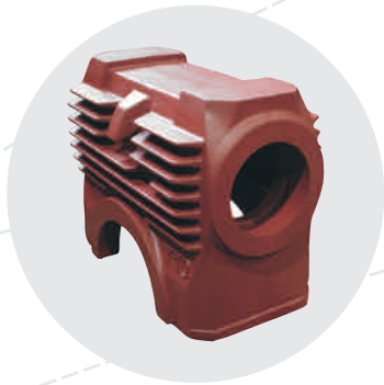
Getriebegehäuse 131 kg, EN-GJL-250