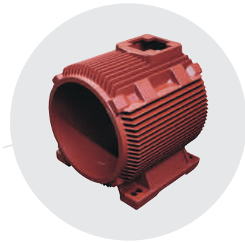
Ständergehäuse 52 kg, EN-GJL-200