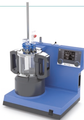
LR 1000 control Laborreaktor Ident-Nr. 0010001035

Rund um das Dispergieren mit T 25 easy clean ergänzen die folgenden Geräte von IKA bei Bedarf Ihr Labor: