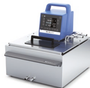
ICC control pro 12 c Einhängethermostaat Ident-Nr. 0010000417