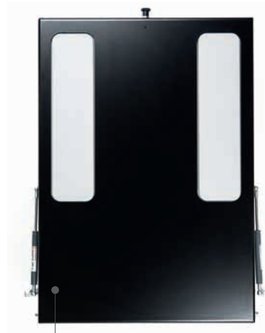
Double Sleeve Pallet