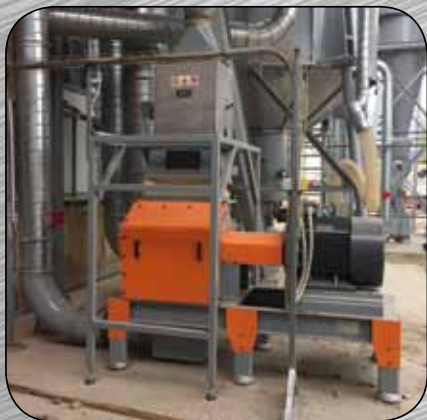
N-RP 03 installato - installed.