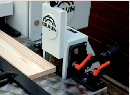
Kantenbürstaggregate (Sonderzubehör) – auf Wunsch höhenverstellbar und schrägstellbar