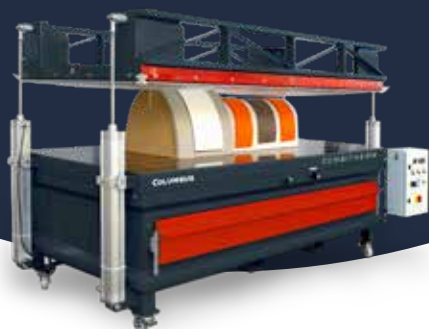
Combitherm mit vertikalem Öffnungsmechanismus