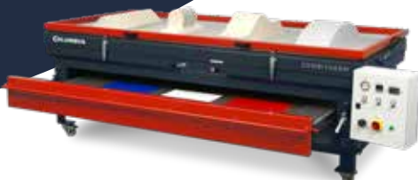
Combitherm mit Klappenöffnung