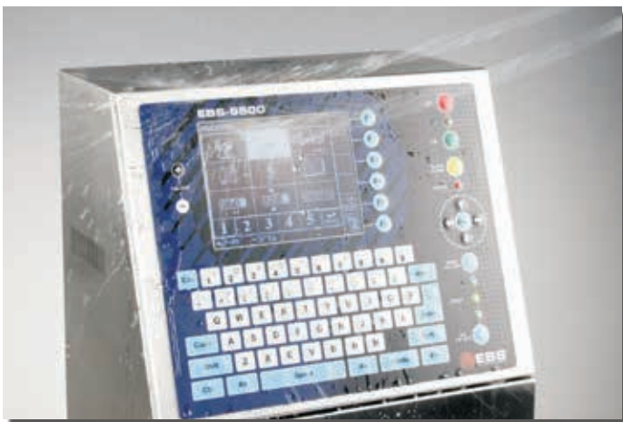
IP54 Schutzklasse - rostfreier Edelstahl IP54 protection class - V2A stainless steel

1-2-3 „iModule®“: Sie benötigen nur 1 Minute. Ohne Werkzeug. Ohne Schmutz. Ein vorbeugender Service den jeder selbst machen kann. Das ist preiswert, schnell und unkompliziert.