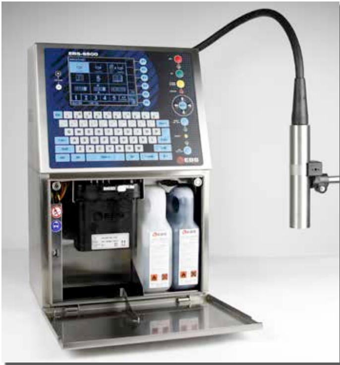
Innen aufgeräumt und leicht zugänglich Easy access

Der Continuous Ink-Jet Drucker Serie EBS 6500 „BOLTMARK®“ für pigmentlose Tinten ist die neue Referenz für Mobilität, Komfort, Betriebssicherheit und Servicefreundlichkeit.