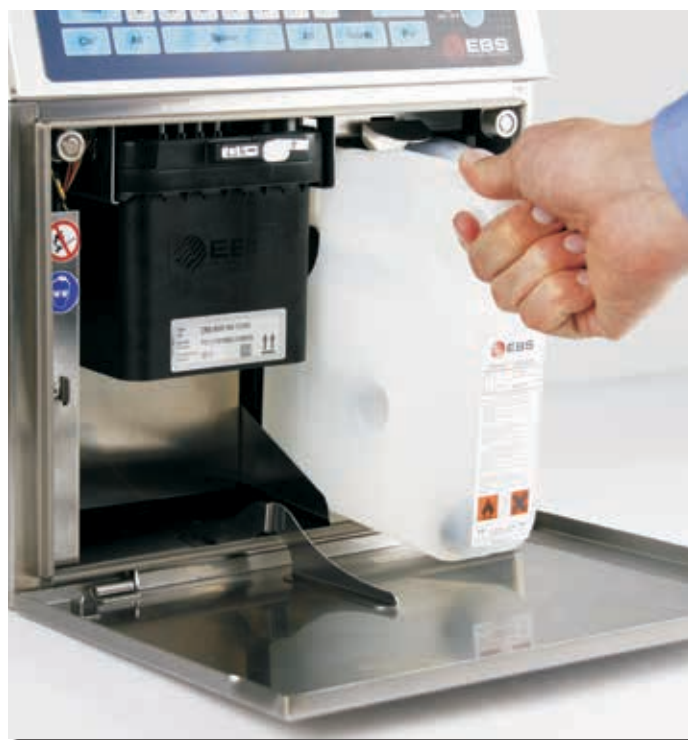
Einfacher, tropffreier Flaschentauch Easy, drip-free bottle change, no spillage!

The Continuous Ink-Jet Printer EBS 6500 „Boltmark“ series for non-pigmented inks is the new reference for mobility, comfort, uptime and customer service friendly.