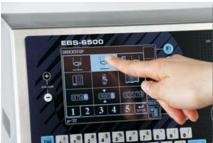
Hoch Kontrast LCD mit Touch Screen High contrast LCD with touchscreen