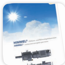
Kühlturm- und Rührwerkgetriebemotoren / Cooling tower- and agitator gear motors