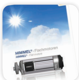
Flachmotoren / Flat motors