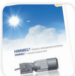
Elektro-Hängebahnantriebe / Monorail conveyor drive