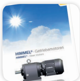
Getriebemotoren / Gear motors

You are interested in further information? Request our further catalogues.