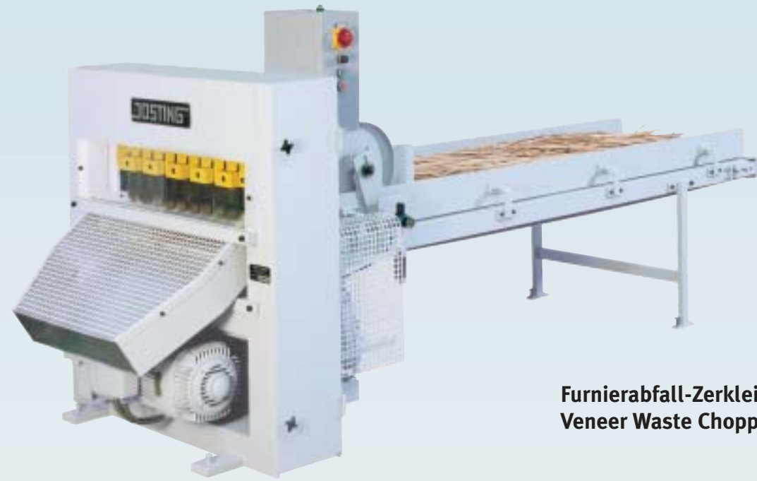
Furnierabfall-Zerkleinerer Veneer Waste Chopper