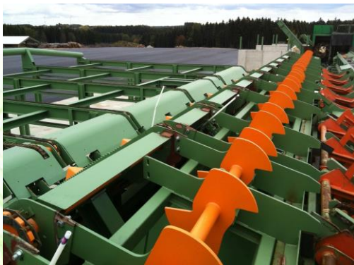
Rundholzzubringung Log in-feed system Navalovanie dlhej guľatiny