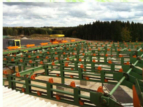
Querkettenförderer Cross-chain conveyor Priečny reťazový dopravník