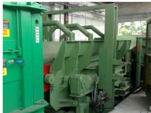
Einzugsysteme vor und hinter der Entrindungsmaschine Centering conveyors for debarkers Dopravníky pred a za odkôrňovačom