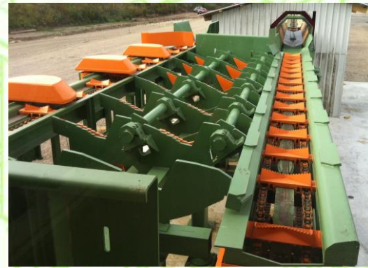
Blockzug mit seitlichem Auswerfer und Beschleunigungsblockförderer Log conveyor with ejectors Prísun krátkej guľatiny