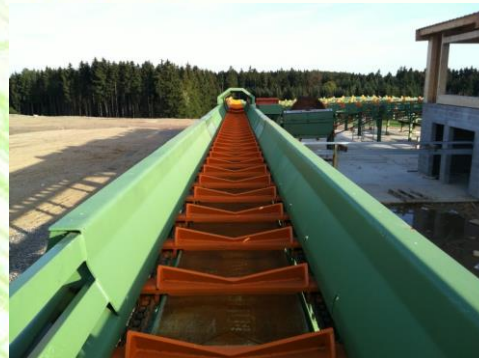
Messförderer Conveyor for log measuring Dopravník pre meranie guľatiny