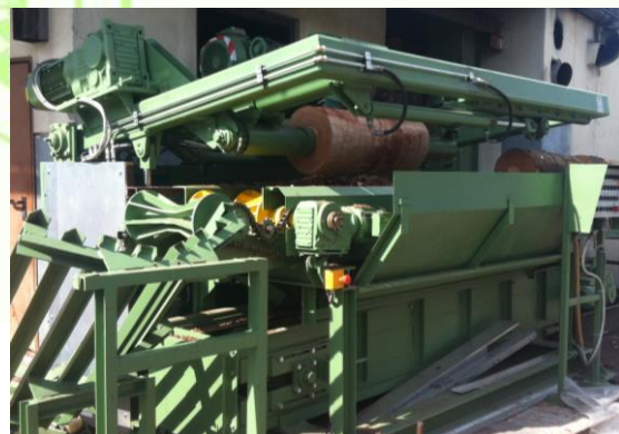
Entrinder für Kurzholz Deberking machine Odkôrňovač krátkej guľatiny