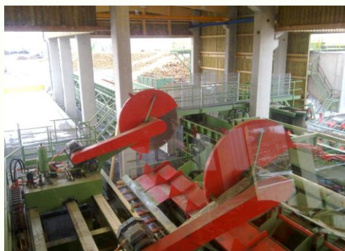
Rundholzkappung Log cross-cutting saw Kapovacia píla na guľatinu