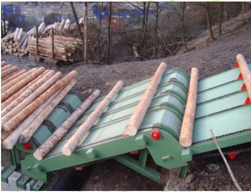
Entzerrer Singulator Rozjednocovač