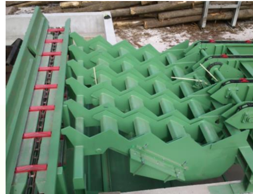
Stufenschieber Step feeder Kaskáda