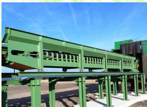
Förderband für Rundholz Belt conveyor for logs Pásový dopravník na guľatinu