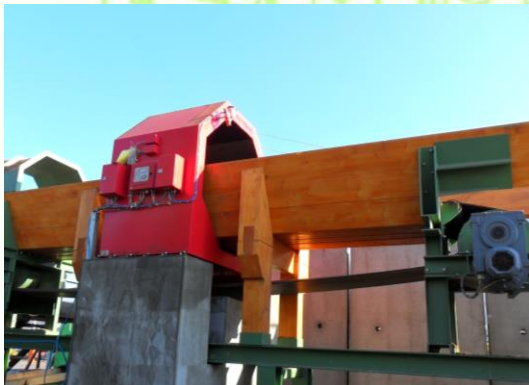
Metallsuchförderband Belt conveyor for metal detector Pásový dopravník pre detektor kovov