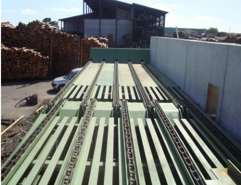
Aufgabequerförderer Log deck Navalovací dopravník