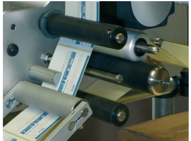
Spendebreiten von 100 bis 200 mm bei Spendegeschwindigkeiten von bis zu 120 m/min sind mit dem REA JET ES Etikettenspender möglich

Das System wurde für folgende Etikettier-Anwendungen optimiert: Rundum-Etikettierung, Boden- und Deckel-Etikettierung, Seiten-Etikettierung, Übereck-Etikettierung und Querbahn-Etikettierung.