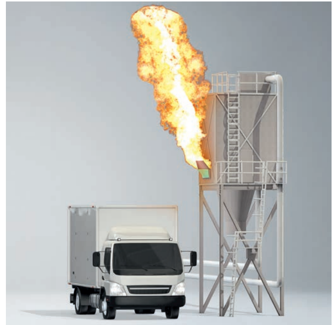
Mit TARGO-VENT: Die Flamme wird in sichere Bereiche gelenkt.