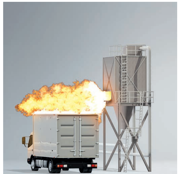
Ohne TARGO-VENT: Die Flamme gefährdet die Betriebsflächen.

Consulting. Engineering. Products. Service.