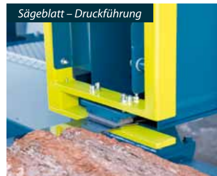
Sägeblatt – Druckführung