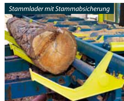
Stammlader mit Stammabsicherung