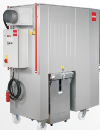
SMU 12 - 30