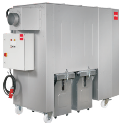
SMU 32 - 45