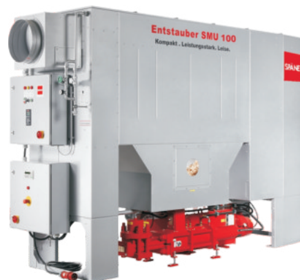
SMU 60 - 100 mit Brikettierpresse