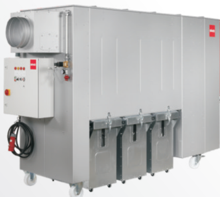
SMU 60 - 100 mit Abfülltonnen