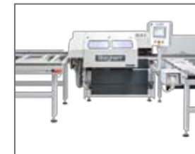
Profilleistensäge GLS-2: Sägewinkelverstellung in zwei Ebenen