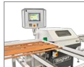
Profilleistensäge GLS: Sägewinkelverstellung bis +/- 81 Grad