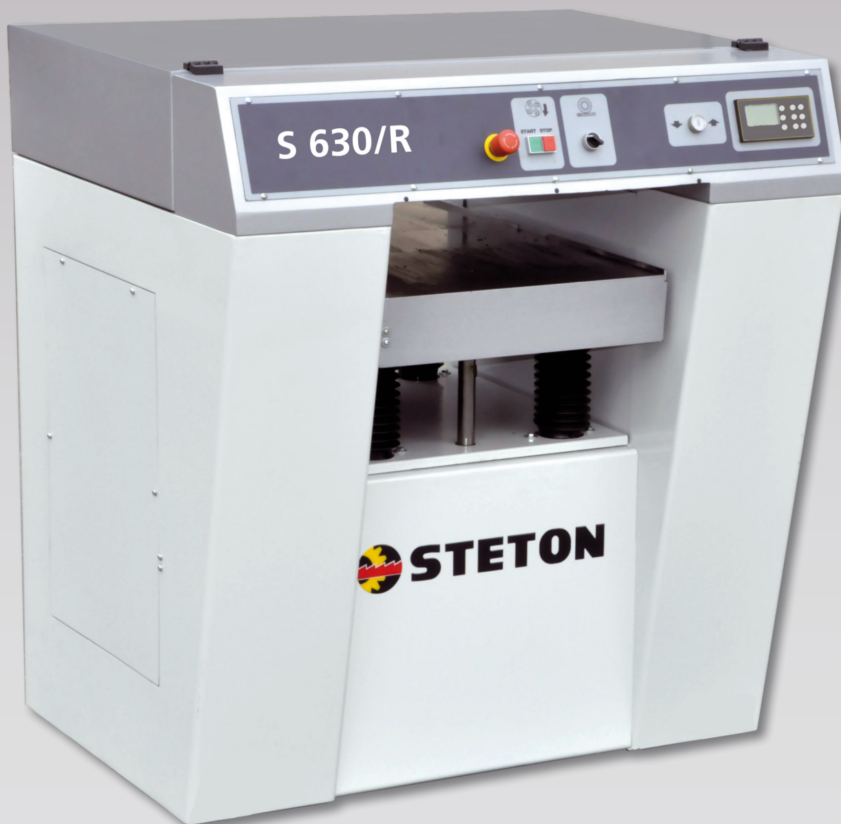
S 630/R CE