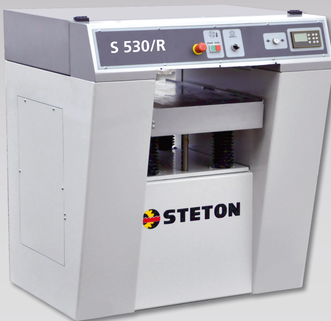
S 530/R CE

S630/R, S530/R se distinguen por abertura 300mm y levantamiento electrico de la mesa.