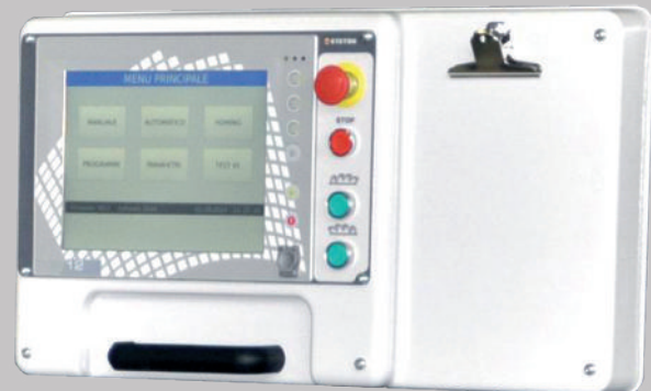
• Touch screen 12"