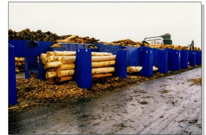
Rundholzsortieranlage mit Boxen für entrindetes Rundholz