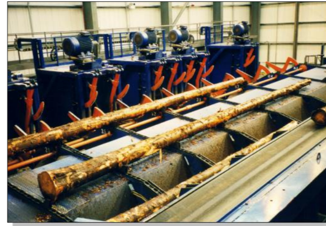
Hochleistungs-Durchlaufkappanlage für Langholz

Auch Maschinen für die Wurzelreduzierung und Entrindung können integriert werden.