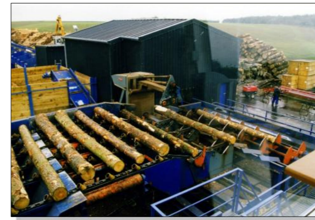
Rundholzanlage mit Wurzelreduzierung