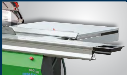
680|20 Breitenanschlag elektromotorisch verstellbar

Die Modelle 680|10 und 680|20 verkörpern eine neue Formatkreissägen-Generation, die Funktion, Farbe und Form in Einklang bringt.