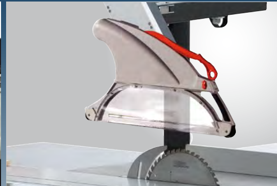
Schutzhaube mit Wechseleinsatz für alle Sägeblattpositionen