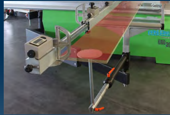
Stützauflage zum Abstützen langer Werkstücke am Anschlaglineal