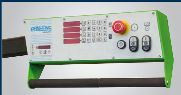
680|20 Bedienpanel in Augenhöhe