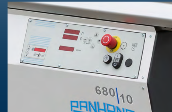
680|10 Breitenanschlag manuell verstellbar